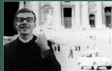
Student in Rom während des 2. Vatikan. Konzils