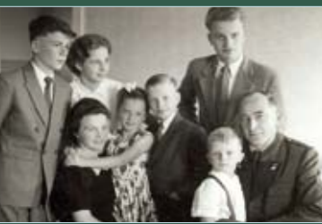
Im Kreis seiner Familie