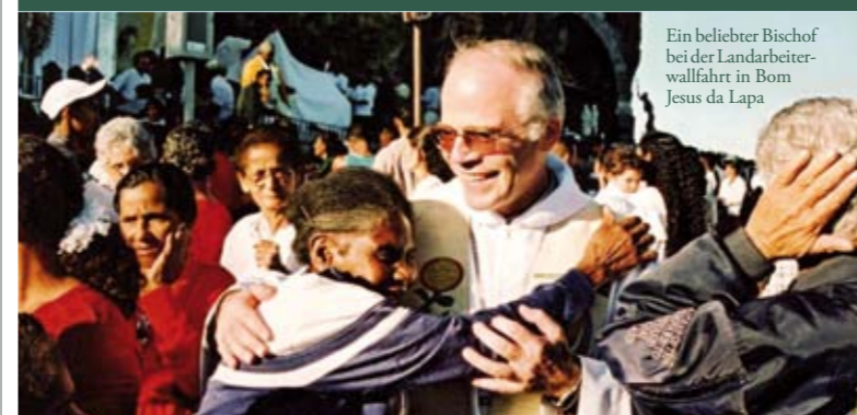
Ein beliebter Bischof bei der Landarbeiter- wallfahrt in Bom Jesus da Lapa