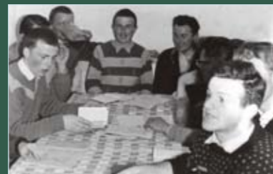
Schüler in Kremsmünster (ganz links)