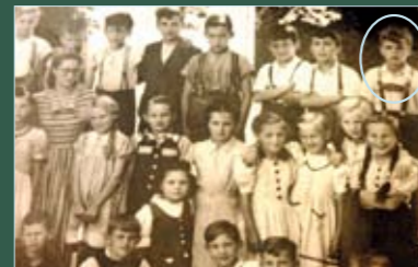
Als Schüler in der VS Gaspoltshofen