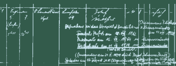
Taufbuch in Bad Leonfelden