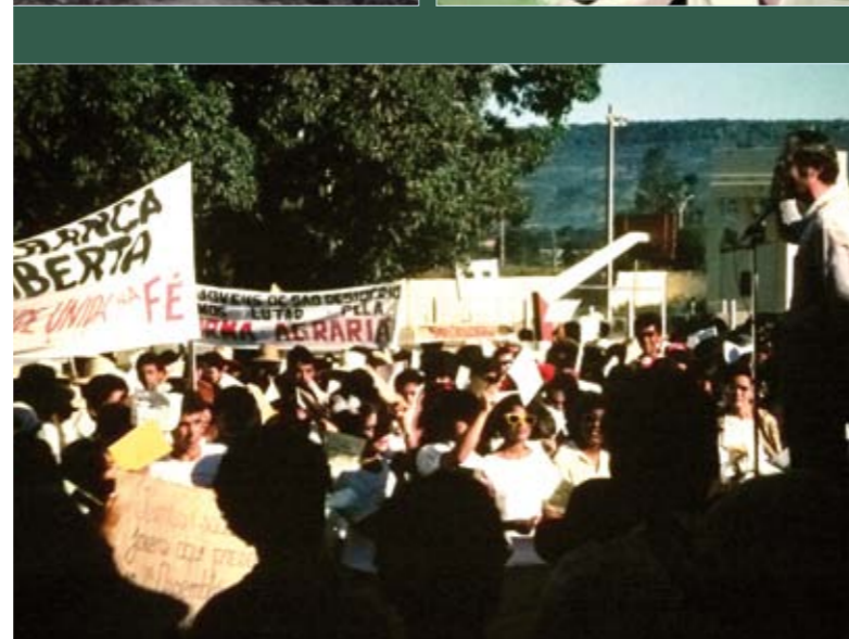
Der Einsatz für die Armen und für eine Landreform (hier auf einer Kundgebung) brachte auch Verfolgung mit sich.

Am 21.5.1979 wurde die Diözese Barreiras gegründet und Pater Richard zum Bischof „Dom Ricardo“ ernannt.