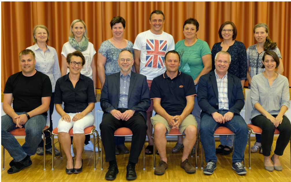
Der neue Pfarrgemeinderat stellt sich am Foto der Pfarrgemeinde vor.