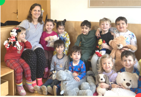
Pyjamas und Kuscheltiere gehören zusammen .