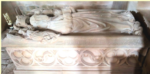
Walburgas Hochgrab/Kirche d. ehem. Klosters Heidenheim

* um 710 in England; † am 25. Februar 779 od. 780 in Heidenheim,