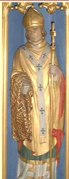
Statue in der Wilfrids-Kirche in York

Die Gründe für die Auseinandersetzungen, die W. Zeit seines Lebens auszufechten hatte, sind nicht völlig geklärt. Die Könige von Northumbrien könnten auf seine Macht und seinen Besitz neidisch gewesen sein. Konflikte gab es wohl auch mit anderen Kirchenmännern.