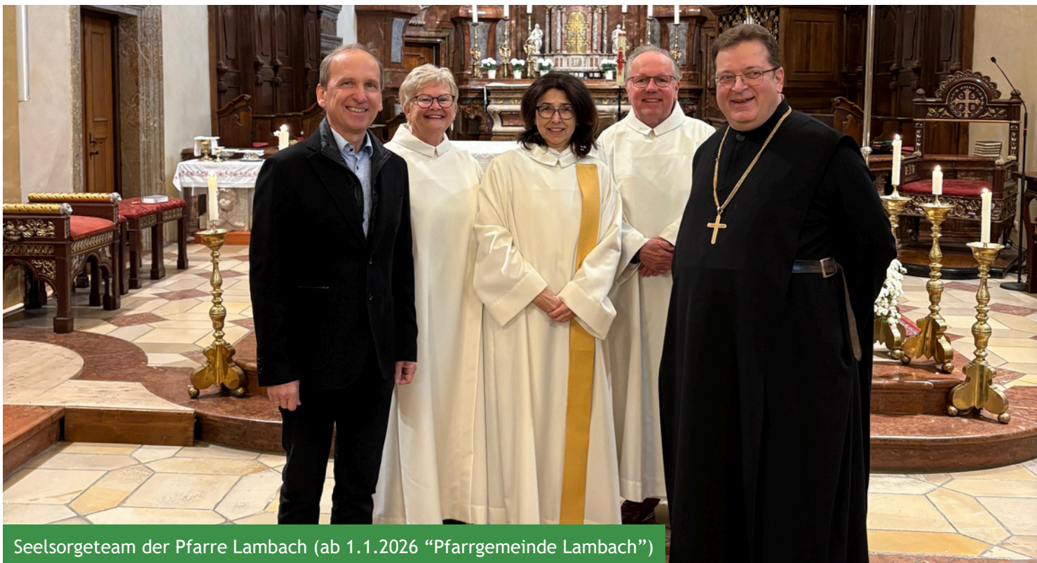
Seelsorgeteam der Pfarre Lambach (ab 1.1.2026 „Pfarrgemeinde Lambach“)

Unser bisheriges Seelsorgeteam wird in Zukunft – gemäß den kirchenrechtlichen Vorgaben – die Pfarrgemeinde Lambach leiten.