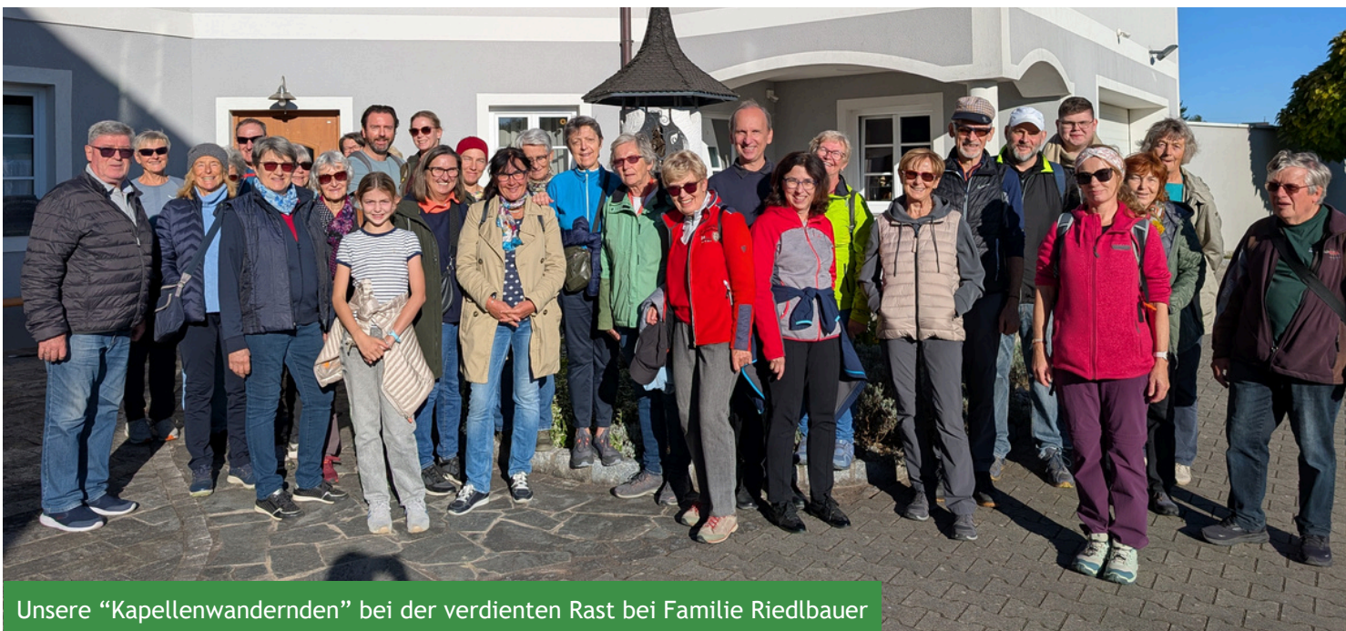
Unsere "Kapellenwandernden" bei der verdienten Rast bei Familie Riedlbauer

Den würdigen Abschluss bildete die Chorkapelle im Stift Lambach, begleitet von geistlichen Impulsen und stimmungsvoller musikalischer Begleitung durch "Laetamur". Danke einerseits an alle, die mitgeholfen haben und mitgewandert sind; andererseits aber auch den Gemeinden Lambach und Edt, welche die Realisierung sowohl der ersten Kapellenwanderung im Mai als auch dieser Herbstwanderung durch ihre finanzielle Unterstützung ermöglicht haben. So wird Geschichte lebendig und Gemeinschaft spürbar.