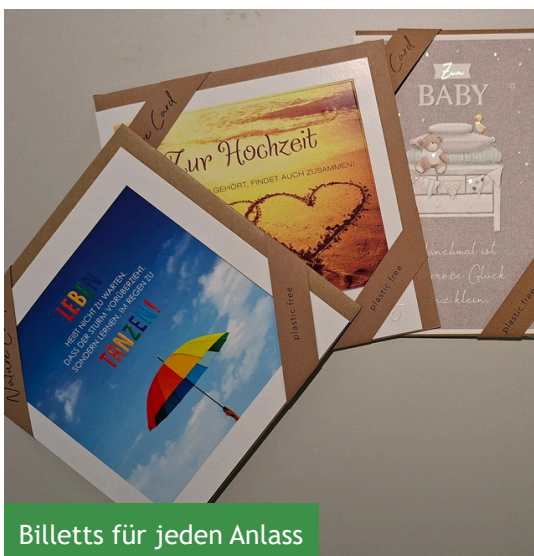
Billetts für jeden Anlass