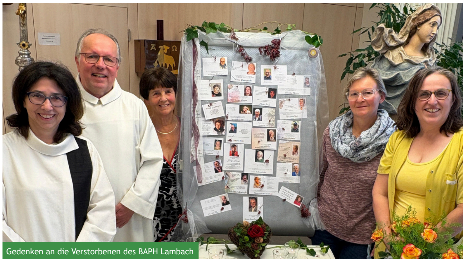
Gedenken an die Verstorbenen des BAPH Lambach