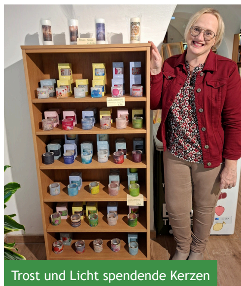
Trost und Licht spendende Kerzen