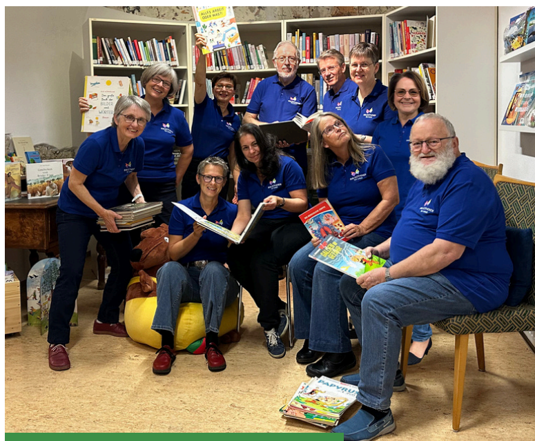
Das Bibliotheksteam im neuen Gewand

Wir bitten um Verständnis, dass die Bibliothek am 24.12. und 31.12 geschlossen bleibt. An allen anderen Öffnungstagen sind wir gerne wieder für Sie da.