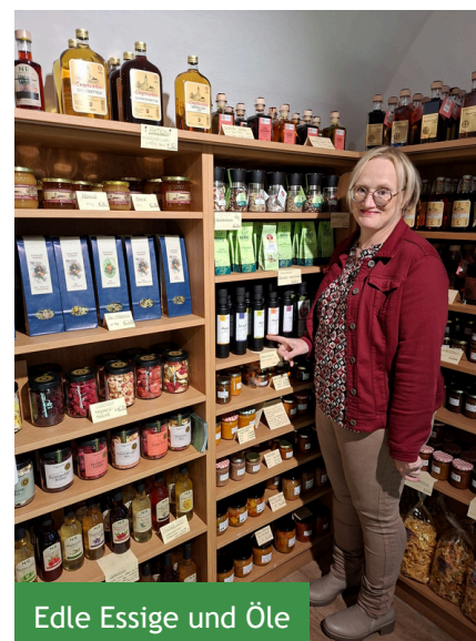
Edle Essige und Öle