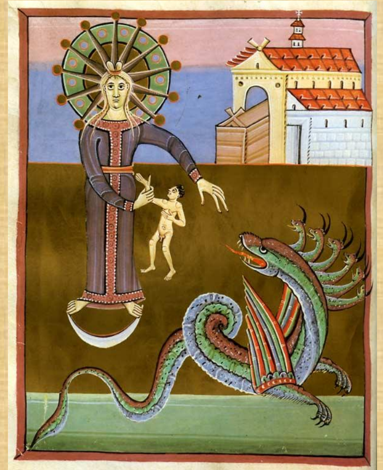
Der Messias wird aus der verfolgten Frau geboren, um mit eisernem Szepter zu herrschen (Offb 12).