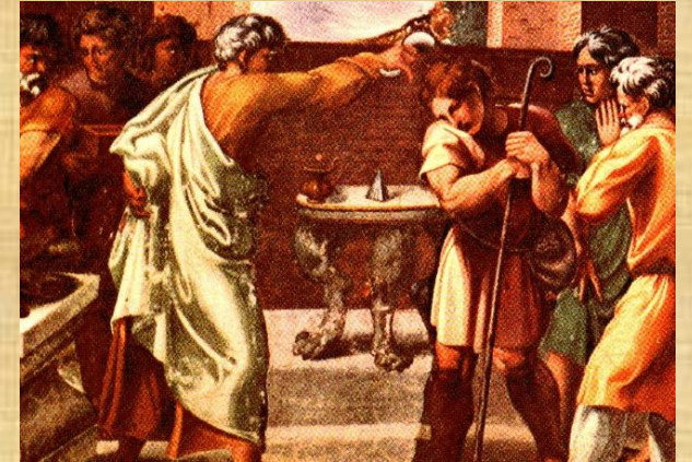
Samuel salbt David (1 Sam 16,13)

– 5 Dann aber spricht er zu ihnen im Zorn, * in seinem Grimm wird er sie erschrecken: