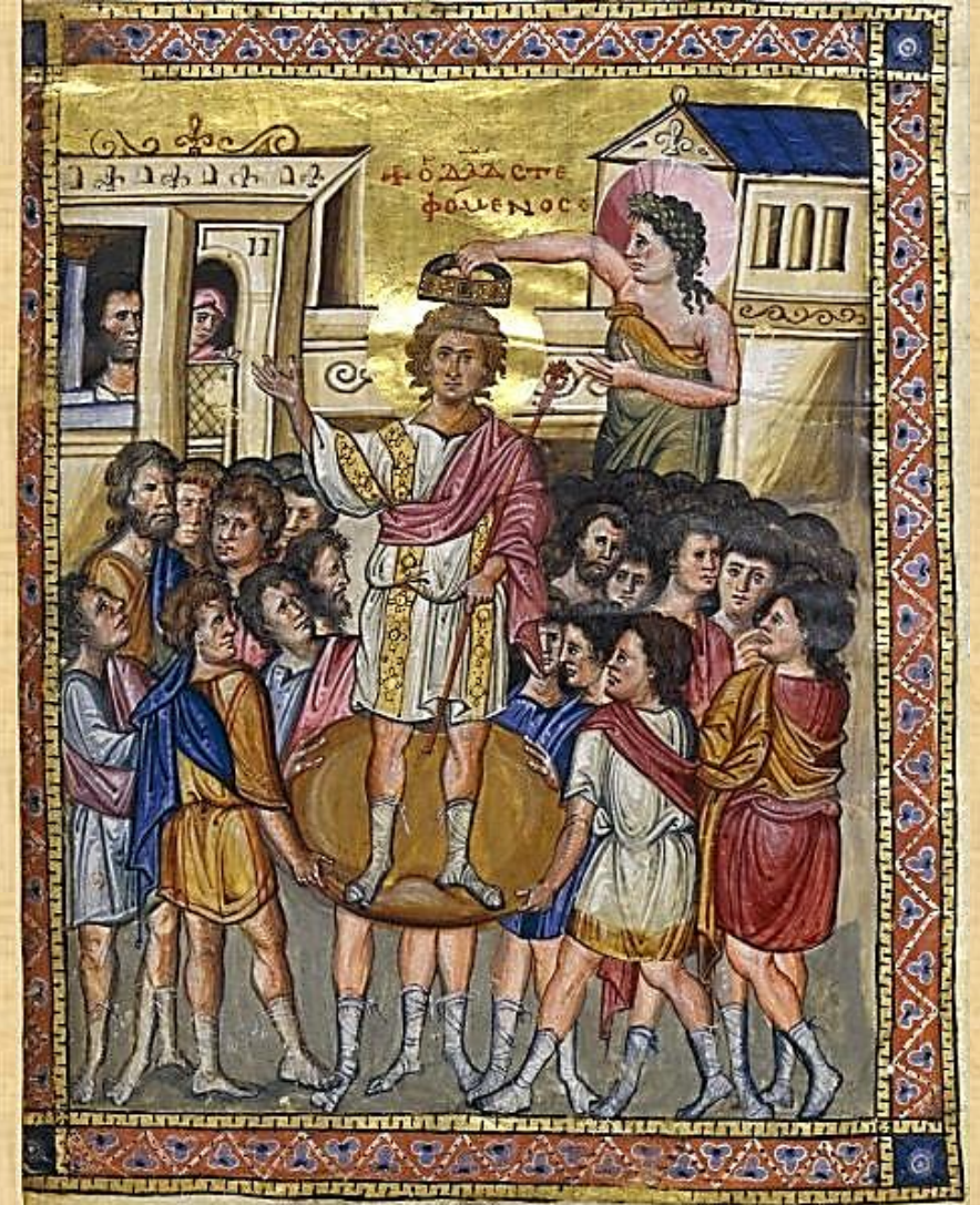
Krönung Davids (Pariser Psalter, 960)

Die Seligpreisung („Wohl ...“) am Ende von Ps 2 bildet mit der am Anfang von Ps 1 eine Klammer. So sind Ps 1 und Ps 2 eine Einheit, eine gemeinsame Einleitung zum gesamten Psalter.