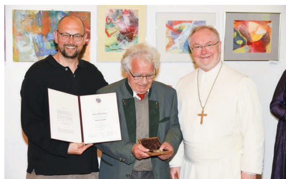
Freude und Blick auf die St. Florian Medaille