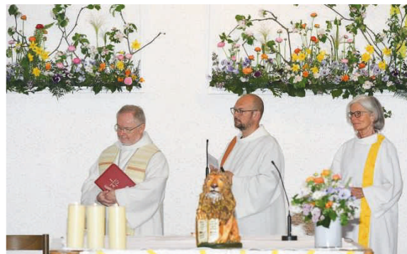
Festlicher Schmuck unserer „Pfarrgärtnerei“