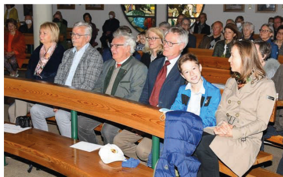
... und Verleihung der St. Florian Medaille