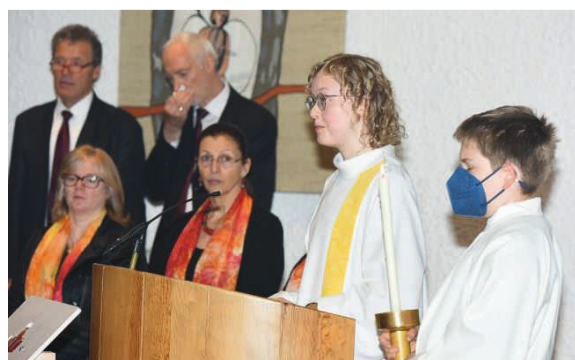
... und schon wieder bei der Arbeit