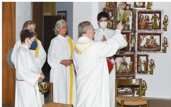
Segnung unseres „Andachtsraumes“