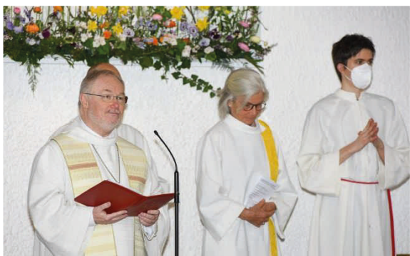
... und Uraufführung der St. Markus Messe ...