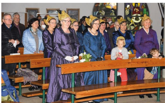
Die BehÜBSCHerinnen der Pfarre