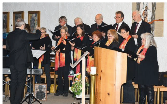
Unser Chor singt die neue St. Markus Messe