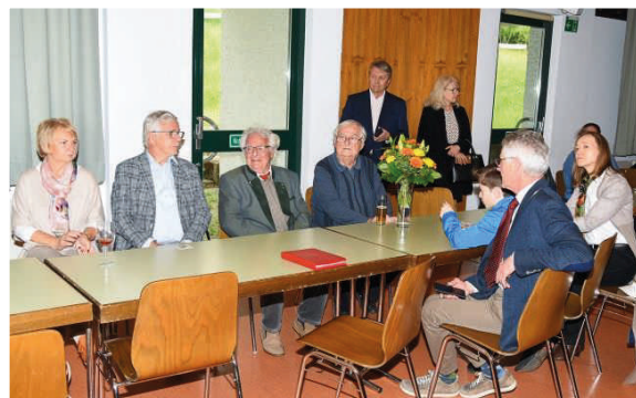
Feiergäste aus Nah und Fern