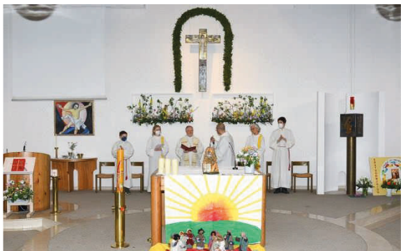
Ein Fest, alles an einem Tag, Patrozinium ...