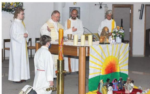
Am Festtag wird Eucharistie gefeiert