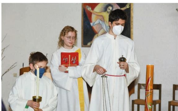
Unsere neue Seelsorgerin (Herztl. willkommen)