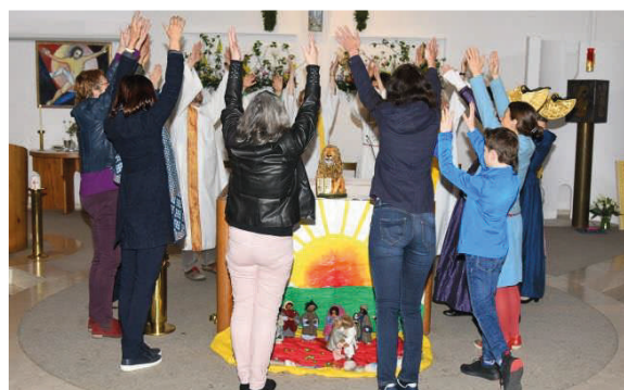
Getanzt wird immer!