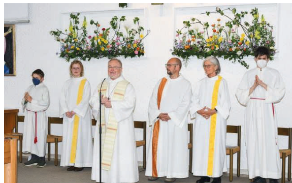
... und Weihe des Andachtsraumes ...