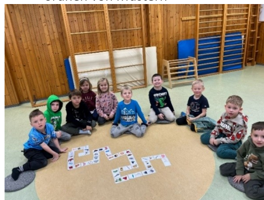
Wir fügen Reime zu einer Wortschlange zusammen