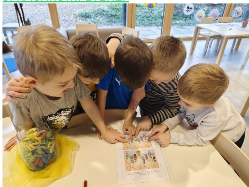
Beispiel - Gruppenarbeit: finde den Fehler

Ich kann Erlebnisse erzählen, kenne viele Wörter, kann Aufträge verstehen und ausführen.