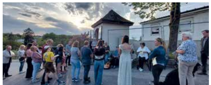
Maiandacht Oberachmann Pestkapelle