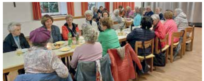
Maiandacht KFB Pfarrkirche