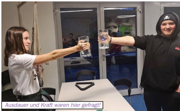
Ausdauer und Kraft waren hier gefragt!

Im September wurden noch die letzten warmen Sommertage genossen und draußen gemeinsam Fußballtennis und Tischtennis gespielt. Mitte September fand das JET-Palaver statt, bei dem alle Jugendlichen eingeladen waren, ihre Ideen und Wünsche für die kommenden Aktionen und für das Jugendzentrum mitzuteilen und ihre Stimme abzugeben. Zünftig ging es Ende September beim jährlichen JET-Oktoberfest zu. Es gab Weißwürste und Brezen zum Essen, beim Nageln konnten die Jugendlichen ihr Geschick unter Beweis stellen und beim Maßkrugstemmen ihre Ausdauer und Kraft.