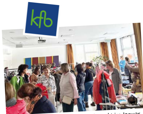
Das war der Frauensachen-Tauschmarkt im Januar