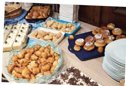
Leckerer Kuchenbuffet am Frauenfasching im Februar