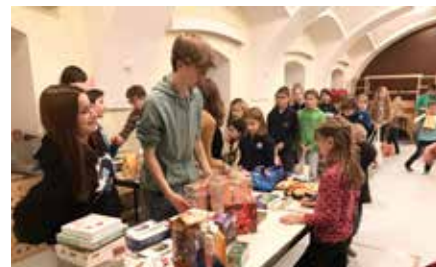
Bei der Sternsinger*innenjause wurden die Süßigkeiten verteilt, es wird gespielt und natürlich gejausnet