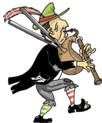
Grafik und Logo zur Orgelroas: Christoph Müller

19:30 Evangelische Kirche danach gemütlicher Ausklang