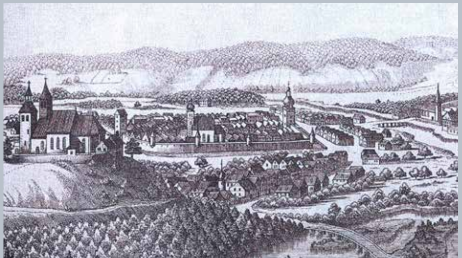
Ansicht von Vöcklabruck 1674, Stich von Matthäus Vischer (Ausschnitt)

„Die altherwürdige Mutterkirche Maria Schöndorf zu Vöcklabruck, weithin sichtbar und majestätisch auf sanftem Hügel gelegen, eingebettet in schöner Voralpenlandschaft, zieht wegen ihres burgähnlichen Aussehens nicht bloß den Blick der Durchreisenden, sondern alljährlich viele Besucher an. Bereits im Jahre 823 erwähnt, ist sie eine der ältesten Kirchen des Landes und die früheste Marienkirche des Bezirkes Vöcklabruck. Sie war die uralte Pfarrkirche von Vöcklabruck und ist die Mutterkirche der Pfarren Attnang, Puchheim, Regau und Timelkam. Infolge ihres beeindruckenden Aussehens, der sehenswerten Kunstschätze und ihrer wunderbaren Madonna „Maria vom guten Rat“ oder „Mutter der schönen Liebe“ erfreut sie sich großer Beliebtheit. Obwohl das Recht der Pfarrkirche unter Kaiser Josef II. auf die zentralere Stadtkirche St. Ulrich (Anm. Stadtpfarrkirche) verlegt wurde, ist Maria Schöndorf immer noch die „geheime“ Hauptkirche für die größten Feste der Pfarre.“ (Leitner 1999.5.)