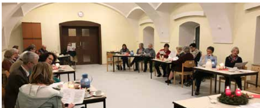
Offenes Singen im Advent im Pfarrsaal (=Turnsaal vom Kindergarten im Pfarrhof)