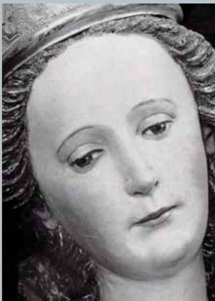
Detailansicht der „Mutter der schönen Liebe“ oder „Maria vom guten Rat“ in Maria Schöndorf

Im Buch „Die bewegte Geschichte von Maria Schöndorf“ hat Leitner 1999 zum 1175. Jubiläumjahr einen detailreichen Geschichtsbeitrag erarbeitet.