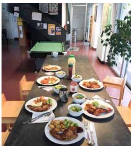
Im YouX kochen Jugendliche selbst

Bei uns im youX können sich die Jugendlichen jederzeit ein gratis Gericht zubereiten. Wir bekommen wöchentlich eine Lebensmittelspende, wovon sich die Jugendlichen mit unserer Unterstützung