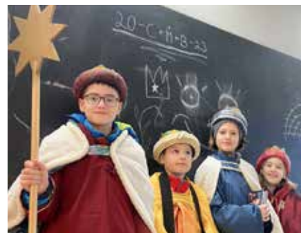
Vier der 63 engagierten, ausdauernden Sternsinger*innen

Es macht uns so stolz, dass wir mit Hilfe aller Vöcklabrucker*innen einen kleinen aber bedeutenden Teil zur Unterstützung von benachteiligten Menschen in der ganzen Welt beitragen dürfen und können.