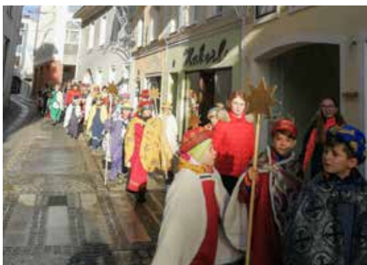
Die Sternsinger am Weg zur Stadtpfarrkirche