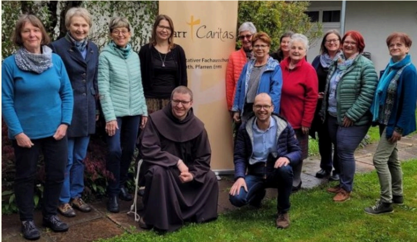
Der sozial-Caritative Arbeitskreis – hier ein Teil der Gruppe nach einer Besprechung – ist eine Initiative der beiden Pfarren St. Laurentz und St. Marien und bietet jeden Montagnachmittag ab 16.30 im Jungcharraum von St. Laurentz eine Sprechstunde für Menschen in Not an.

Jede menschliche Gesellschaft braucht Solidarität. Wir tragen Verantwortung füreinander, und ganz besonders für Schwache, Arme und Benachteiligte. Leichtfertige gesellschaftliche Tendenzen zu Ausgrenzung, Polarisierung und Egoismus sind der falsche Weg.