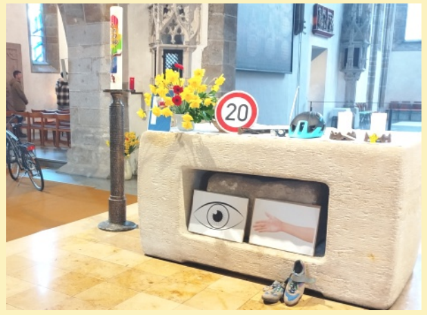
Rechtzeitig zur beginnenden Fahrradsaison wurde in St. Laurenz ein Fahrradgottesdienst gefeiert, bei dem auch die Fahrräder gesegnet wurden.