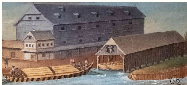
Salzhafen-Anlagen in der Ennser Vorstadt Enghagen Ausschnitt aus dem Votivbild „Hl. Niklaus“ (1762)