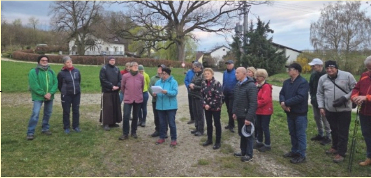
30 fröhliche Frühaufsteher haben den Ostermontag bei der Emmauswanderung gefeiert. Sie haben unterwegs gesungen, gebetet und sich zu brennenden Themen unterhalten. Darauf wartete das Frühstück im Pfarrsaal von Enns-St. Marien.