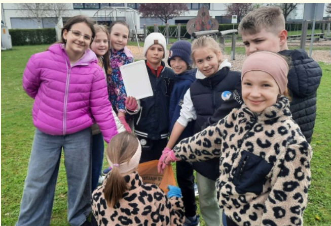
Auch das kann Religionsunterricht sein: Müllsammeln rund um die Schule und Auseinandersetzung mit Umwelt und Schöpfung.