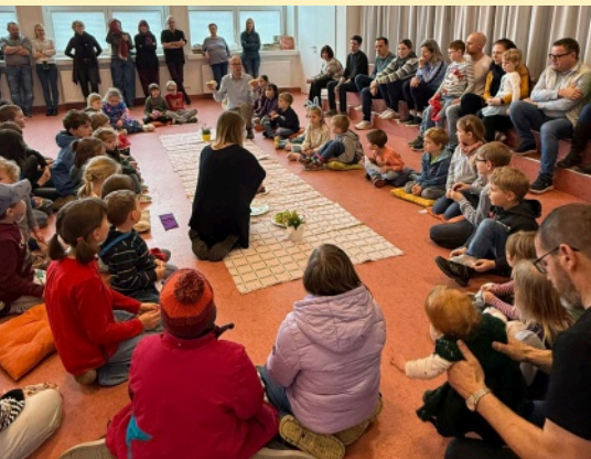
Bei der „Osterfeier für Kinder“ im Pfarrheim St. Laurenz erlebten zahlreiche Kinder und Eltern die verschiedenen Stationen des Ostergeschehens.