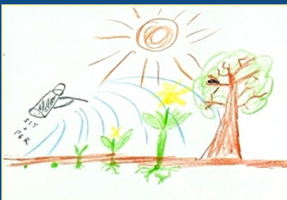
Zukunft der Seelsorge, Seite 8