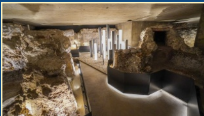
Basilikaführungen, Seite 7

Anhand von Jesus kann ich durch biblische Geschichten und Deutungen zeigen, dass Gebrochenes wieder ganz werden kann, dass der/das Geknickte nicht abgebrochen wird und dass das gebrochene Brot in der Kommunion uns alle – mich „eingeschlossen“ – heilen und gesund machen kann.