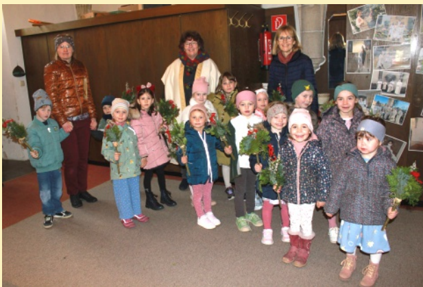
Freude und Erwartung lag in den Augen der Kindergartenkinder von St. Laurenz, als sie am Palmsonntag auf den „Einzug in Jerusalem“ warteten.

Die Kreuzigungsgruppe, die lange zur Restauration entnommen war, ist wieder an ihrem Platz am Ende der Linzer Straße: sie wird am Fronleichnamstag wieder gesegnet.