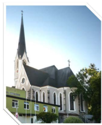
Pfarrkirche Schwanenstadt