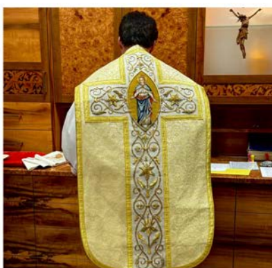
Fatimamesse - 13.10.25