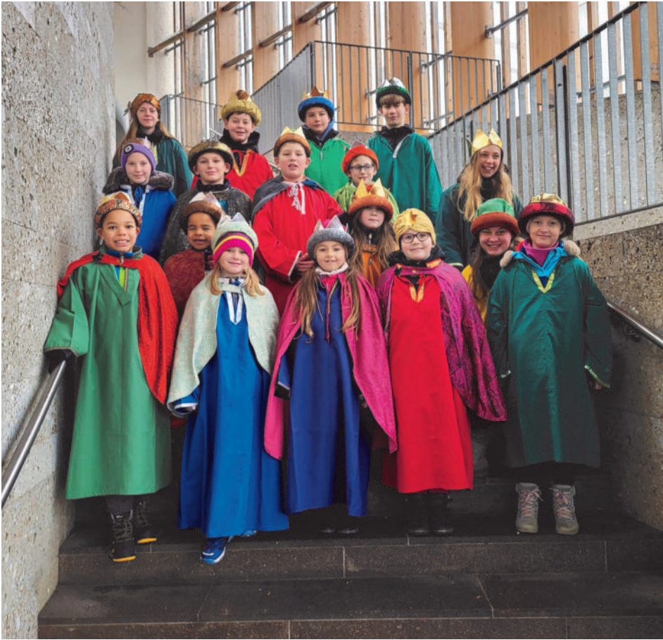
Ein Teil der 32 Gallsbacher Königinnen und Könige.