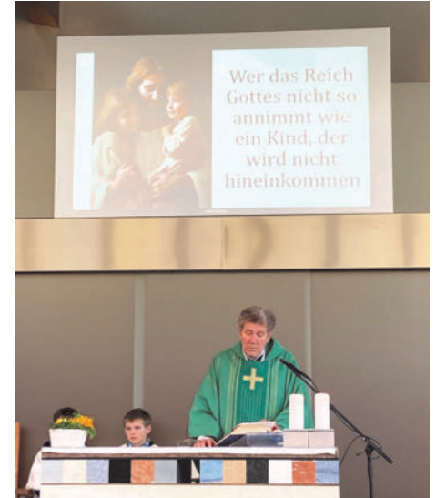
Einsatz der Medientechnik während der Hl. Messe