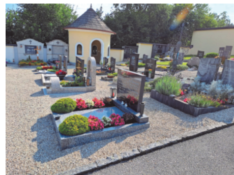
Unser schön gepflegter Friedhof