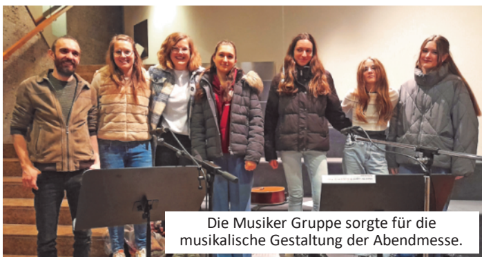
Die Musiker Gruppe sorgte für die musikalische Gestaltung der Abendmesse.