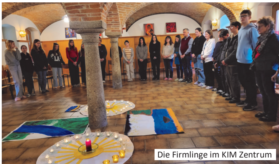
Die Firmlinge im KIM Zentrum