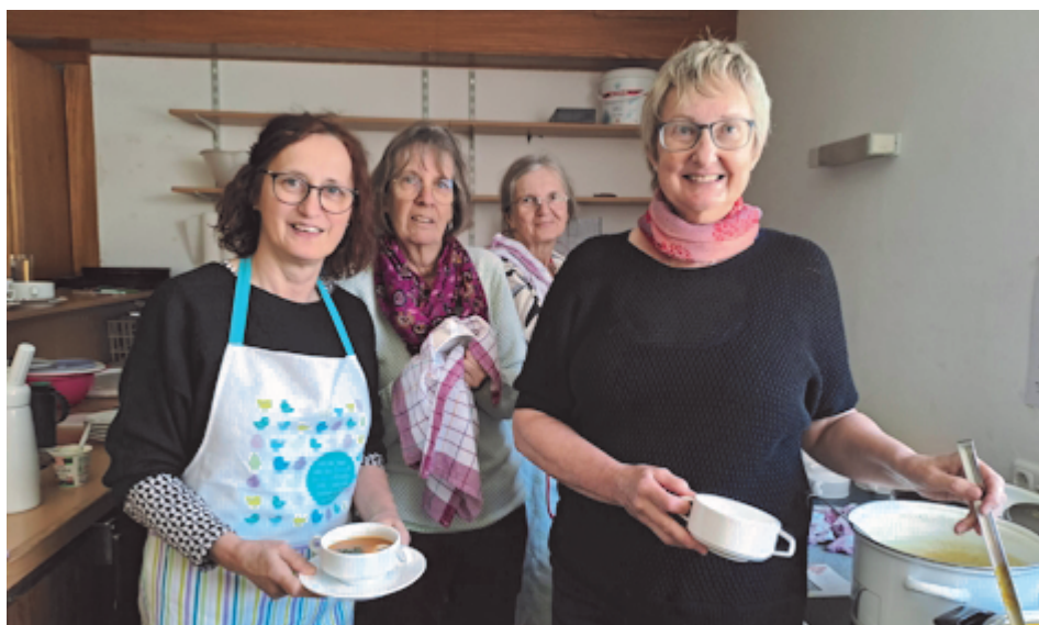
Fleißige Helfer der KFB in der Küche des Pfarrsaales beim Fastensuppenessen

Herzliche Einladung zum nächsten Frauenpilgertag, am Samstag, 11.10.2025 – näheres wird noch bekannt gegeben.