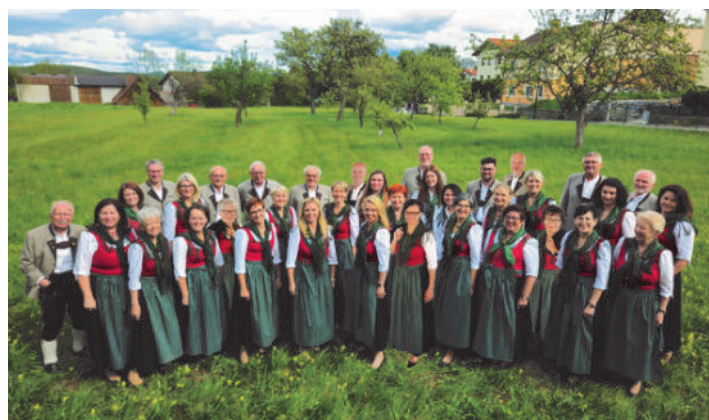
Der Gesangverein „Eiche“ Penk aus Niederösterreich wird am Pfingstmontag die Hl. Messe musikalisch gestalten.

Aktuelle Termine incl. eventueller Terminänderungen finden sie auf der Homepage der Pfarre.