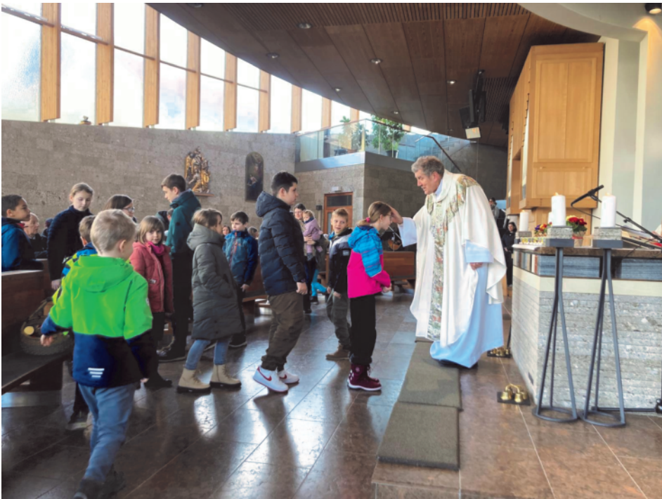
Kindersegnung nach dem Gottesdienst.