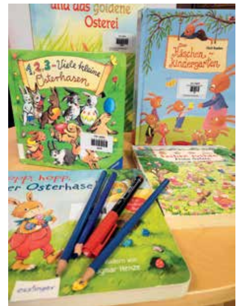
Beim Ostergewinnspiel für Kinder winkt eine Jahresmitgliedschaft.

Text: Birgit Koxeder-Hessenberger