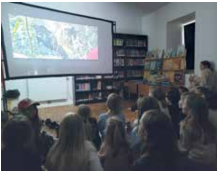
Kino, Popcorn, Bücher: Die Lange Nacht verzaubert Groß und Klein.

Am 24. April ist es wieder so weit: Unsere Pfarrbücherei beteiligt sich an der „Langen Nacht der BiblioÖtheken“ und öffnet ihre Türen für einen ganz besonderen Abend voller Geschichten und neuer Eindrücke. Hintergrund der landesweiten Veranstaltung ist, Bibliotheken als wichtige Treffpunkte und soziale Räume in Gemeinden hervorzuheben.