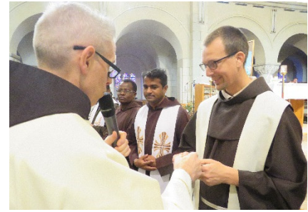
Mit dem Generalminister des Franziskanerordens