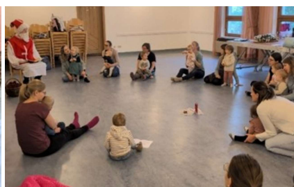
Besuch vom Nikolaus