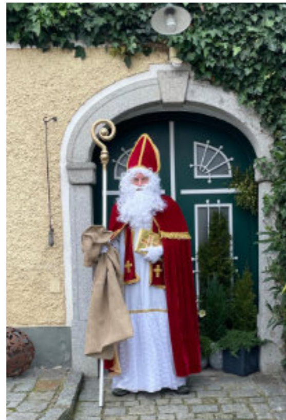
Der Nikolaus