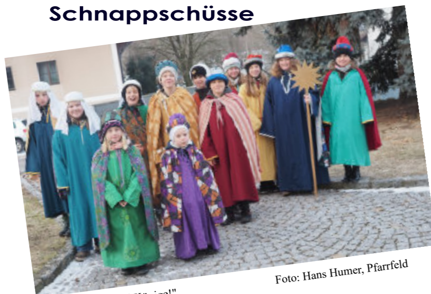
Viele „Heilige drei Könige!“