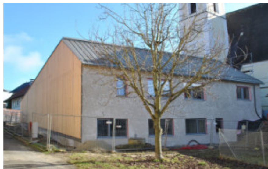
Nord- und Westseite

Die Fliesenleger der Fa. Bau-Bast begannen am 2. Februar mit dem Verlegen der Fliesen.