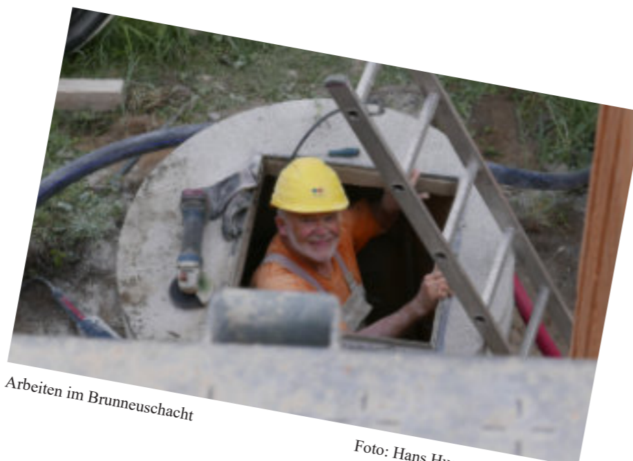
Arbeiten im Brunneuschacht