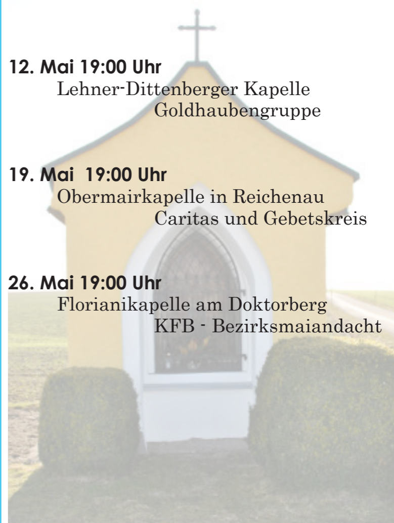
Obermairkapelle in Reichenau

Florianikapelle am Doktorberg KFB - Bezirksmaiandacht