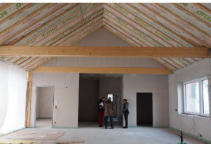
Der Estrich liegt