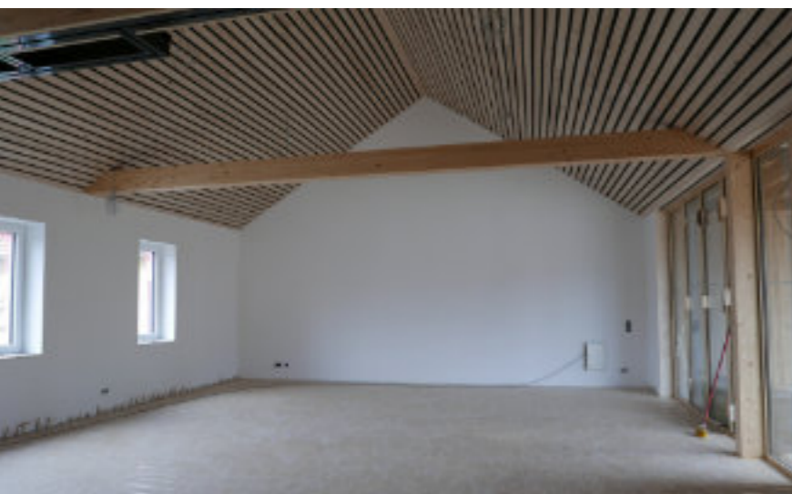
6 Der Parkettboden liegt und die Akustikverschalung ist montiert