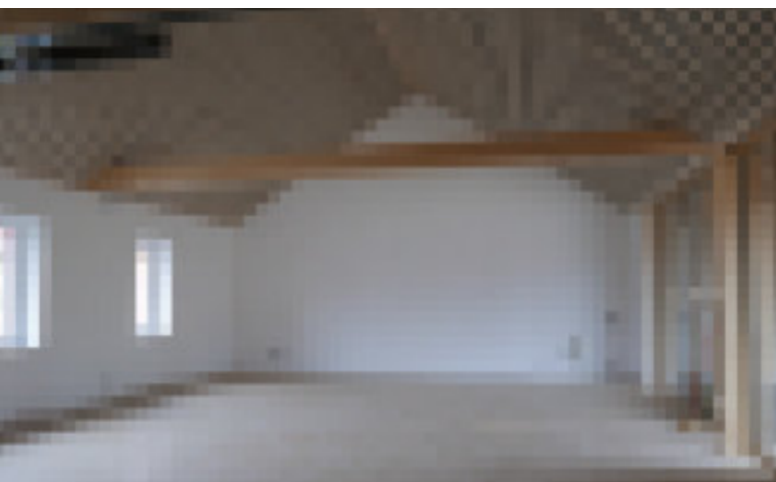
6 Der Parkettboden liegt und die Akustikverschalung ist montiert