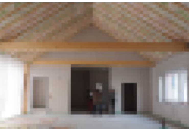
Der Estrich liegt