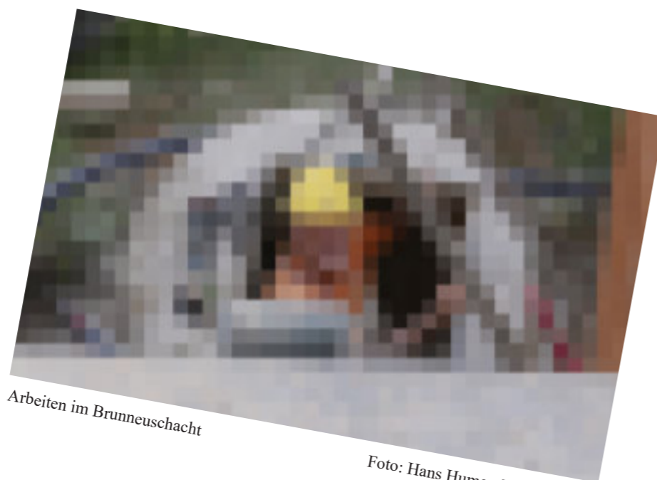
Arbeiten im Brunneuschacht