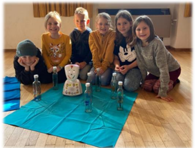
Gestalten der Weihwasserflaschen