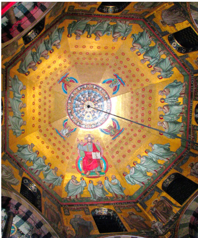
Foto: Aachener Dom

MITTEILUNGSBLATT der Pfarre Weißkirchen im Jahr 2018