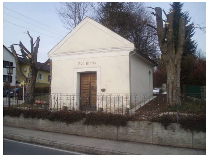
▲ Die trostlose Fassade vor der Renovierung