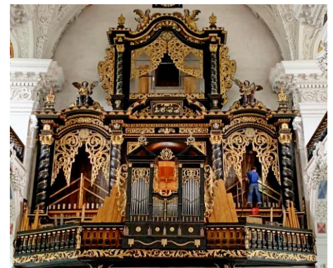
Orgel ohne Pfeifen während der Sanierung

Die Orgelsanierungsarbeiten unserer Anton Heiller-Organ in der Stiftskirche haben termingemäß am Montag, 28.Juni 2021 begonnen.