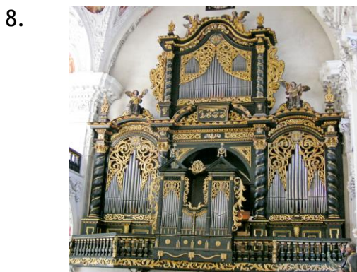
Orgel vor der Sanierung

Die Orgelsanierungsarbeiten unserer Anton Heiller-Organ in der Stiftskirche haben termingemäß am Montag, 28.Juni 2021 begonnen.