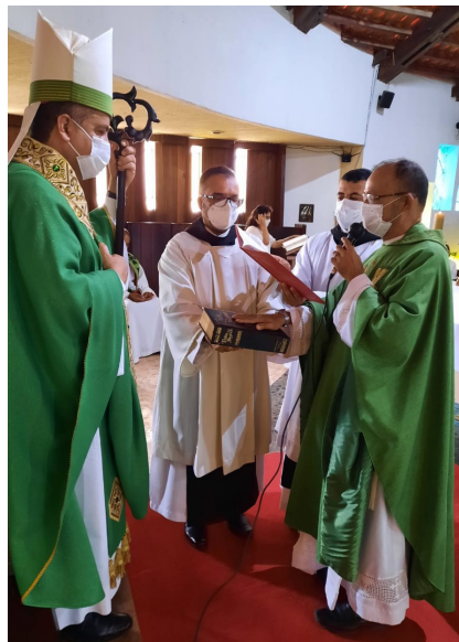
Pastoral im Kloster

Am 29. Jänner wurde die Bäckerei Divina Pastora im Kloster Jequitibá für die Bevölkerung und das Kloster eröffnet. Derzeit noch als Experiment, das sich gut entwickelt.