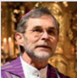
Josef Grünwidi , Erzbischof von Wien, in seiner Predigt beim Festgottesdienst am 11. März 2026 bei der Frühjahrsvollversammlung der Bischofskonferenz in Pischelsdorf

„Ich vertraue darauf: Unsere Kirche wird jesuanischer und evangeliumsgemäßer, wenn wir synodal – gemeinsam auf dem Weg – sind, mehr auf die Stimmen der Frauen hören und sie in Entscheidungsprozesse einbeziehen. Freilich müssen dafür kirchliche Vorschriften und jahrhundertealte Traditionen geändert werden. Aber der Blick auf Jesus, der sich, wenn notwendig, über jüdische Gebote und religiöse Traditionen hinweggesetzt hat, um den Willen Gottes erfüllen zu können, sein Umgang mit Frauen und die feste Überzeugung: ‚Was vom Heiligen Geist kommt, kann das Kirchenrecht nicht aufhalten!‘, machen mir Hoffnung.“