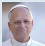
Papst Leo XIV. in seiner ersten Osterbotschaft am Ostersonntag, 5. April 2026 im Vatikan

„Wer Waffen in der Hand hält, lege sie nieder. Wer die Macht hat, Kriege zu beginnen, entscheide sich für den Frieden. Nicht für einen Frieden, der mit Gewalt erzwungen wird, sondern durch Dialog. Nicht mit dem Willen, den anderen zu beherrschen, sondern ihm zu begegnen.“