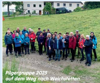
Pilgergruppe 2025 auf dem Weg nach Weichstetten.