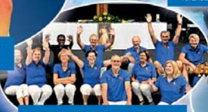
Lobpreisteam Pray Station