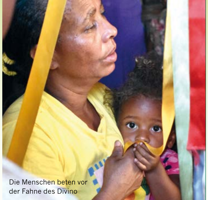
Die Menschen beten vor der Fahne des Divino