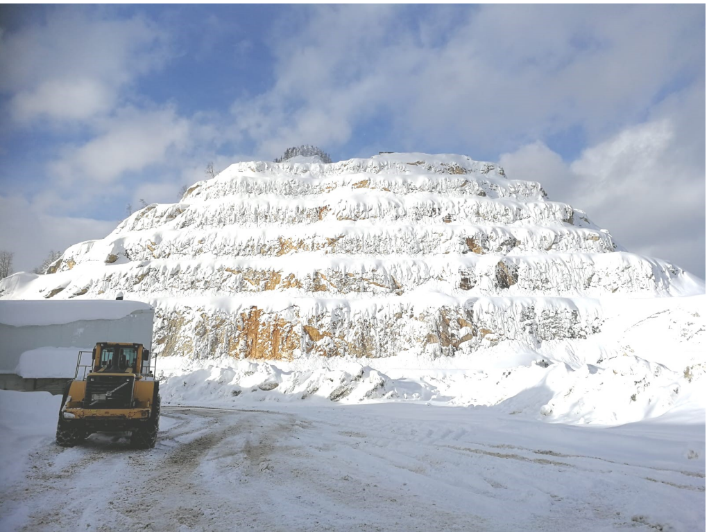
"Voestalpine Stahl GmbH - Kalkwerk Steyrling" Beobachte und deute!

MITTEILUNGSBLATT der Pfarre Weißkirchen im Jahr 2019