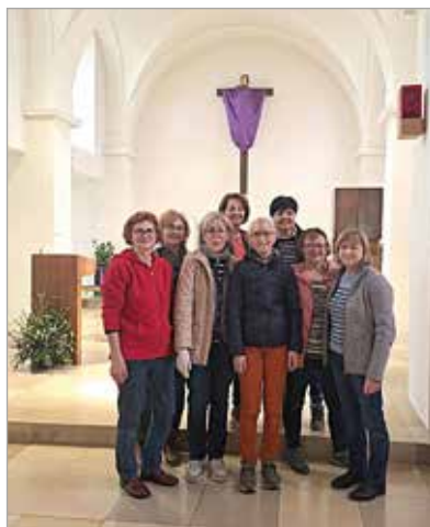
31.03.2026: Osterputz in der Kirche Danke den fleißigen Putzfeen!