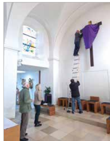
31.03.2026: Verhüllen des Kreuzes - etwas Schwindelfreiheit ist dabei erforderlich.