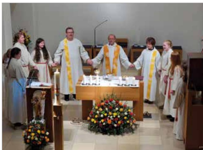
04.04.2026: Feier der Osternacht in der festlich geschmückten Kirche