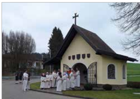
29.03.2026: Palmsonntag - Segnung der Palmbuschen bei der Feuerwehrkapelle und anschließende Eucharistiefeier musikalisch umrahmt vom Kirchenchor