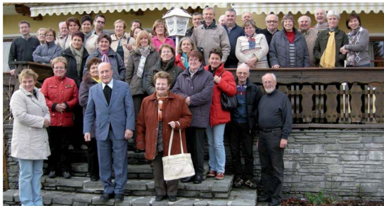
Die Teilnehmer des Pfarrausfluges

26.10.10 Pfarrausflug in das Mondseeland - auf den Spuren Meinrad Guggenbichlers. Messfeier in der Wallfahrtskirche „Maria Hilf“ in Mondsee.