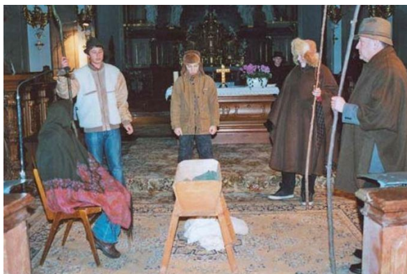
„Die Hirten bei der Krippe“

19.12.10 Bei optimalen äußeren Bedingungen fand am 4. Adventsonntag das Wilheringer Weihnachtsspiel statt. Die dank eines beispielhaften Einsatzes aller Mitwirkenden exemplarisch gelungene Aufführung unter der Spielleitung des Chronisten war auch erfreulich gut besucht.