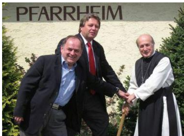
Abb. 28: Spatenstich, 1. 5. 2007

01.05.07 „Aufbruch zum Umbruch“. Eine Hauptaufgabe in diesem Jahr ist die Renovierung und Erweiterung des Pfarrheims.