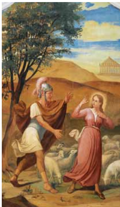
• Wandfresko im Chorraum: Der römische Stadtpräfekt Olibrius verliebt sich in Margarita

An der Chorwand sind Szenen aus dem Leben der Kirchenpatronin St. Margarita (Margareta von Antiochien) zu sehen: Der römische Stadtpräfekt Olibrius verliebt sich in die schöne Jungfrau, als er sie beim Schafehüten erblickt. Bei einem Verhör durch ihn bekennt sie sich zu ihrem christlichen Glauben und lässt sich davon nicht abbringen. Deshalb ins Gefängnis geworfen, wird Margarita