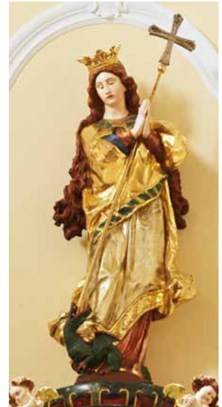
• Statue der hl. Margarita • am neubarocken Hochaltar