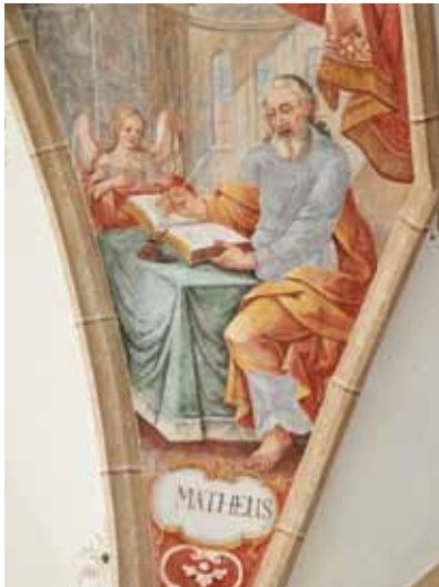
• Barockes Fresko in der Taufkapelle