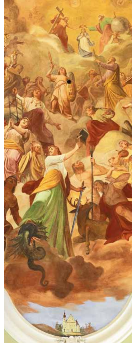
• Detail des Gewölbefreskos im Presbyterium: Die hl. Margarita besiegt den Drachen

Das große Gewölbefresko des Presbyteriums zeigt über der Niederthalheimer Pfarrkirche die 14 Nothelfer (zu denen auch die hl. Margarita im Vordergrund zählt) bei der Krönung Mariens durch die Hl. Dreifaltigkeit; in den umgebenden Zwickelbildern erscheinen die vier Evangelisten sowie die Apostelfürsten Petrus und Paulus.