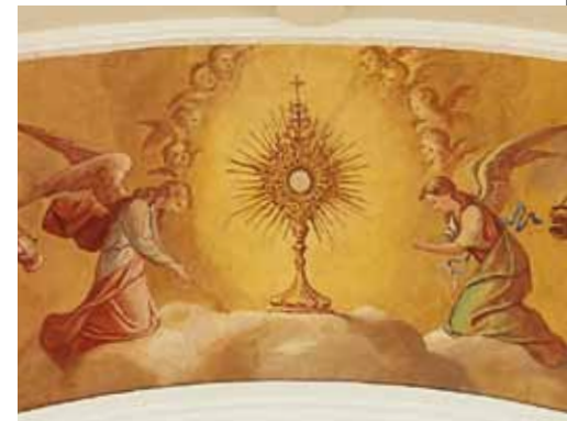
• Monstranz, Fresko im Scheitel des Triumphbogens

Im Scheitel des Triumphbogens , der den Übergang vom Kirchenschiff