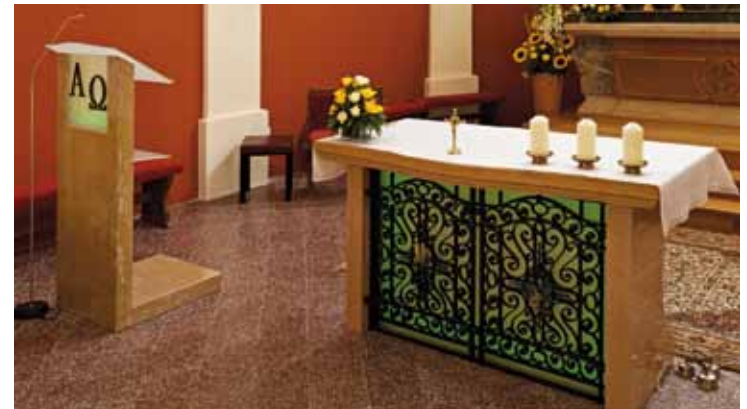
• Volksaltar und Ambo