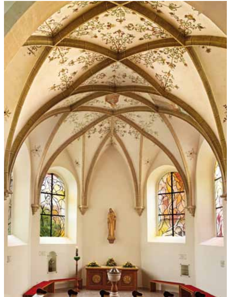
• Altarraum der alten Kirche, heute Taufkapelle

Die Seitenaltäre in den beiden kleinen Kapellen neben dem Chorbogen stammen aus dem Jahr 1891 und gleichen sich in ihrem einfachen Aufbau in Form einer Rundbogennische. Darin steht jeweils eine aus Masse gegossene Statue aus dem zweiten Drittel des 19. Jahrhunderts: auf der linken Seite die Maria Immaculata, auf der rechten Seite der hl. Josef mit einer weißen Lilie.