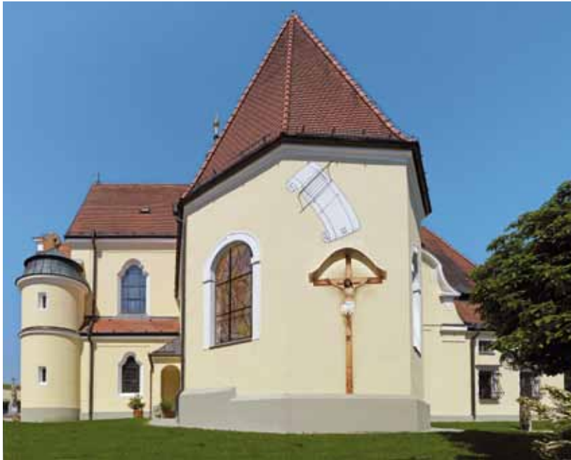
• Blick auf den spätgotischen Chor