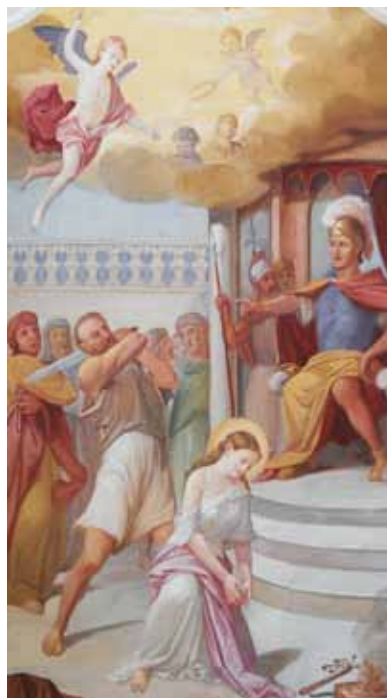
• Wandfresko im Chorraum: Margarita wird zum Tod durch Enthaupten verurteilt

von Engeln getröstet, aber auch vom Teufel in Gestalt eines Drachen versucht; dieser zerbirst, als sie das Kreuzzeichen über ihn macht (weswegen der Drache zu ihrem Attribut wird; s. Abb. S. 1). Schließlich wird Margarita zum Tod durch Enthaupten verurteilt. – In den beiden Rundbildern der östlichen Seitenwand sind die Hl. Familie und das Letzte Abendmahl vergegenwärtigt.