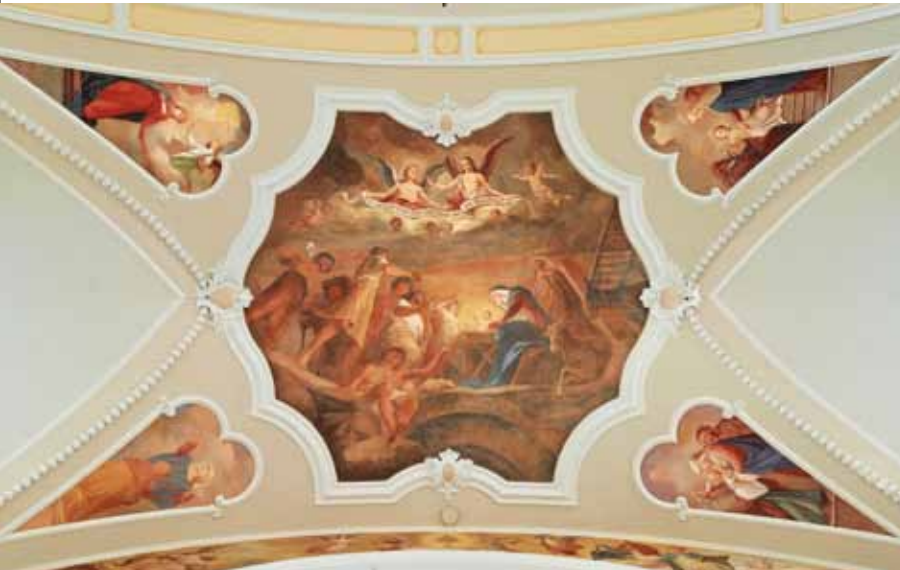
• Fresko im Kirchenschiff: Freudenreicher Rosenkranz

Am Gewölbe des Kirchenschiffes sind die 15 Rosenkranzgeheimnisse dargestellt, wobei jeweils vier um das entsprechende fünfte in der Mitte gruppiert sind: Beim freudenreichen Rosenkranz (vor dem Chorbogen) ist um das Bild der Geburt Christi (Weihnachten) zu sehen, wie Maria den Menschensohn vom Hl. Geist empfängt, ihre Base Elisabeth besucht (und von dieser gepriesen wird), den neugeborenen Jesus im Tempel aufopfert und den zwölfjährigen Knaben im Tempel wiederfindet. Beim glorreichen Rosenkranz ist um die Geistsendung (Pfingsten) dargestellt, wie Christus von den Toten aufersteht, in den Himmel auffährt, seine Mutter Maria in den Himmel aufnimmt und krönt. Beim schmerzhaften Rosenkranz (vor der Orgel) sind um die Kreuzigung Christi (Karfreitag) sein Blutschwitzen am Ölberg, seine Geißelung, seine Dornenkrönung und sein Kreuztragen gezeigt.