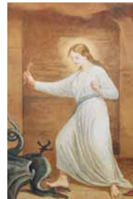
Hl. Margarita Detail: Wandfresko im Chorraum

Diözese Linz – Bezirk Vöcklabruck im Hausruckviertel Land Oberösterreich