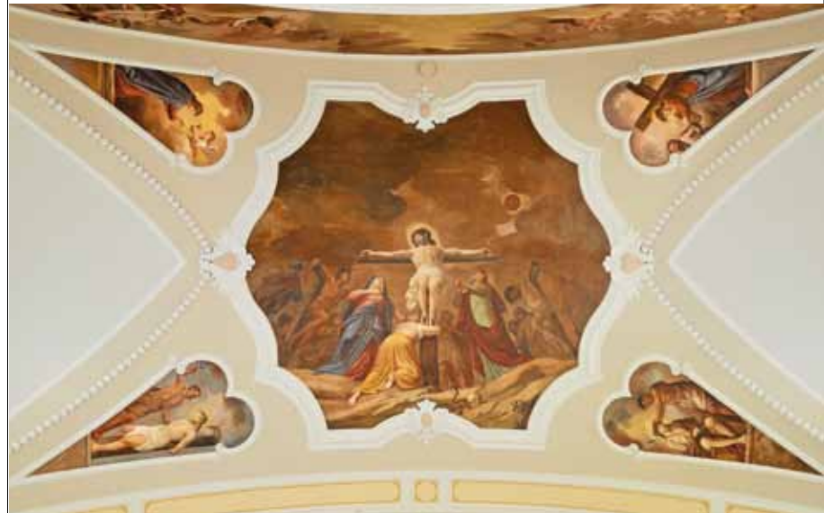
• Fresko im Kirchenschiff: Schmerzhafter Rosenkranz