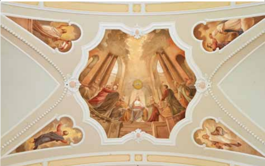
• Fresko im Kirchenschiff: Glorreicher Rosenkranz

Am Bogen über der Orgelempore sind seitlich die Patrone der Kirchenmusik, die hl. Cäcilia und König David (s. Umschlagrückseite innen), und darüber musizierende Engel aufgemalt.