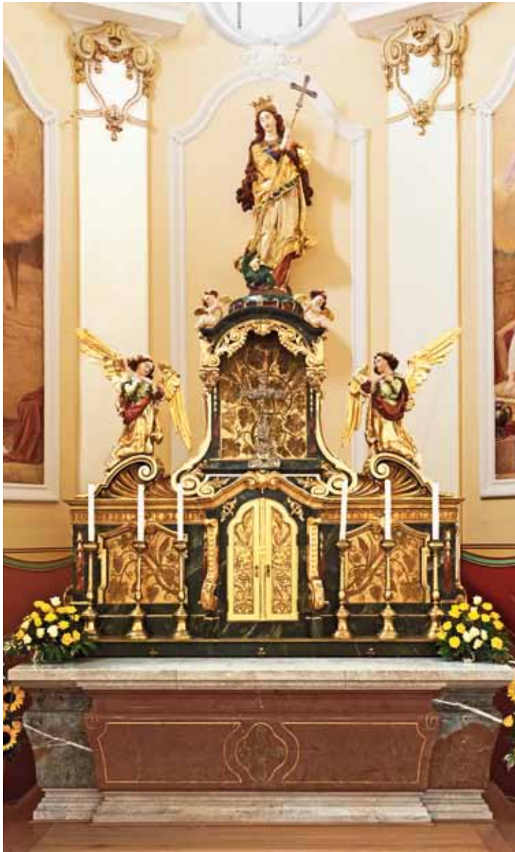
• Der neubarocke Hochaltar

Der neue Volksaltar mit Ambo wurde am 1. September 2013 durch Diözesanbischof Ludwig Schwarz geweiht. Die Steinmetzarbeiten stammen von Konrad Fruhwirth (Ried), die Schmiedearbeiten von Bernhard Grill (Niederthalheim) und die Elektrotechnik von Polzinger (Niederthalheim). Er birgt Reliquien der heiligen Märtyrer von Lorch sowie anderer Heiliger. Die verwendeten Materialien haben einen Bezug zur alten Kirenausstattung: Der Marmor entspricht dem der Kommunionbank, die Kunstschmiedegitter sind ehemalige Torflügel davon, und das sandgestrahlte Milchglas stammt aus der Werkstatt in Schlierbach. LED-Beleuchtung verleiht dem Altar die jeweilige liturgische Farbe des Kirchenjahrs; denn traditionell sind in dieser Pfarrkirche die Altäre zu bestimmten Anlässen angestrahlt.