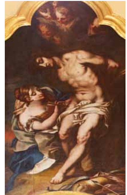
• Barockes Gemälde: Pflege des verwundeten hl. Sebastian