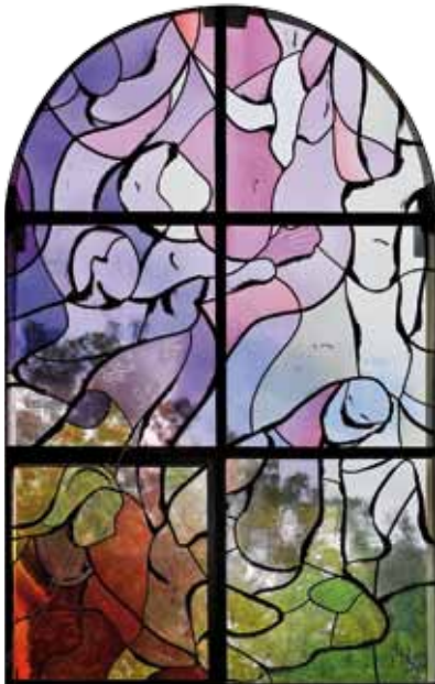
• Fenster in der Taufkapelle: Geborgenheit

1962 kamen im alten Chor am Gewölbe die Jahreszahl 1073 und das Fresko der hl. Margarita zum Vorschein. Bei der jüngsten Renovierung wurde ein barockes Fresko aus dem 1. Drittel des 18. Jahrhunderts freigelegt, es zeigt den Apostel Matthäus.