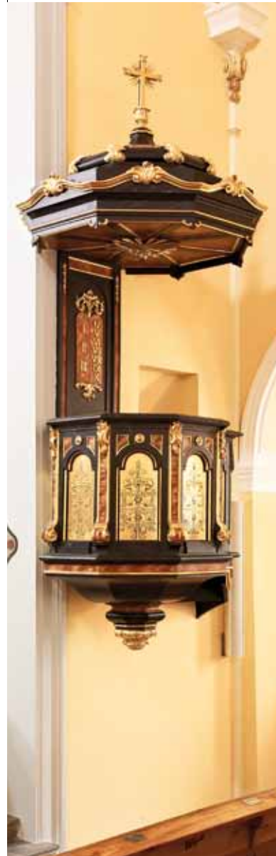
• Neubarocke Kanzel

Geborgenheit: Gott hält seine schützende Hand über uns.