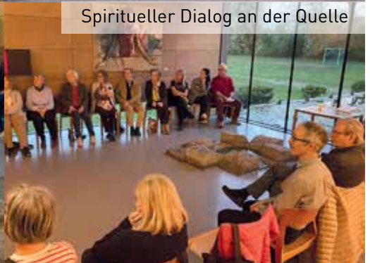
Spiritueller Dialog an der Quelle