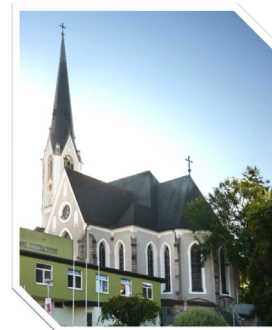
Pfarrkirche Schwanenstadt

Zur Mitfeier des Gottesdienstes laden wir Sie sehr herzlich ein.