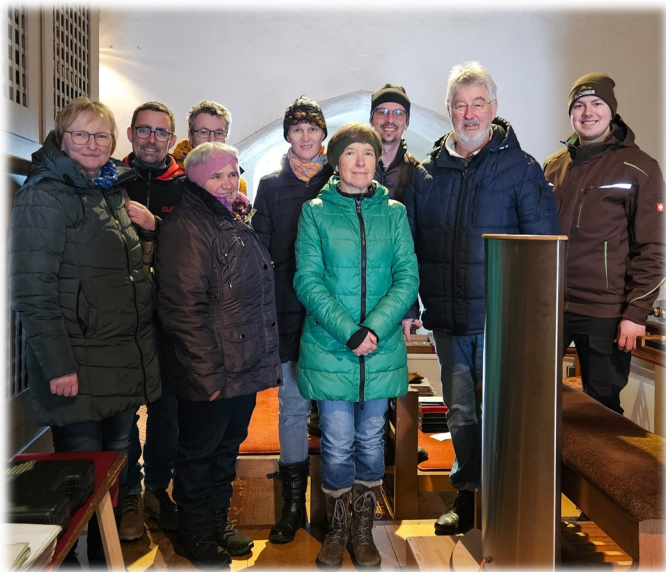
Personen auf dem Foto:

Mit seiner Fachkompetenz und humorvollen Art erweckte der Orgelbaumeister bei der interessierten Gruppe Begeisterung und Vertrauen.