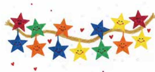
Sterne leuchten uns den Weg zum Jesuskind

Jedes Kind ist eingeladen, einen Stern auszumalen, auszuschnneiden und bei den beiden Wort-Gottes-Feiern mitzubringen ( Eine Malvorlage liegt dem Pfarrbrief in Lacken bei ). Wir freuen uns auch über viele selbstgebastelte Sterne. Für jeden mitgebrachten Stern gibt es eine kleine Überraschung. Helfen wir alle mit, die Krippe am Heiligen Abend zum Strahlen zu bringen!