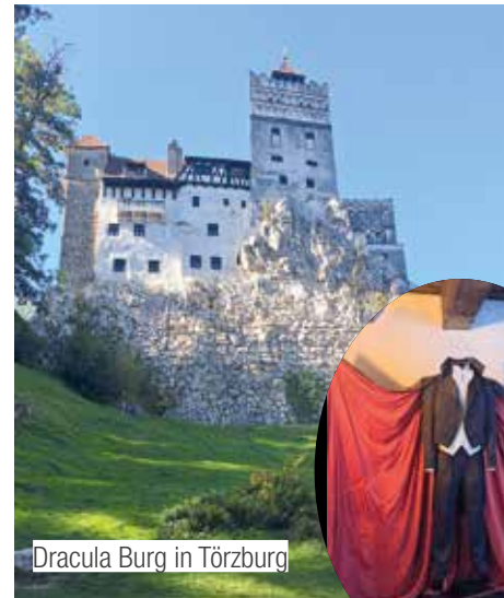
Dracula Burg in Törzburg