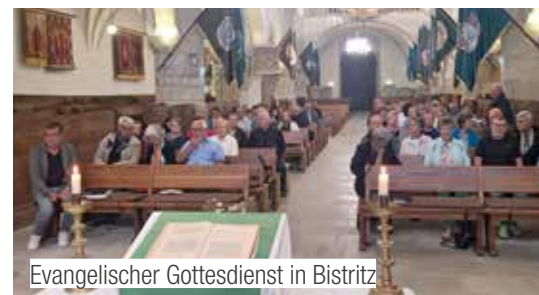
Evangelischer Gottesdienst in Bistritz

Zum Abschluss des Tages erkundeten wir Timisoara (Temeswar), Kulturhauptstadt 2023, mit ihren prachtvollen Jugendstil- und Barockbauten.