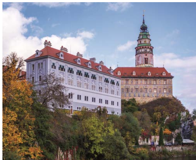
Schloss Krumau

Kurzer Rückblick: In diesem Jahr wurden zwölf kirchliche Feste vom Kirchenchor musikalisch gestaltet. Der Vierge-sang brachte sich in verschiedenen Besetzungen bei Gsunga & Gspüt im Mannerhof , beim Steinbrecherhaus und bei einigen Messen gesänglich ein. Bei den Jubelhochzeiten kam die erstmals aufgeführte Poxrucker-Messe Frischer