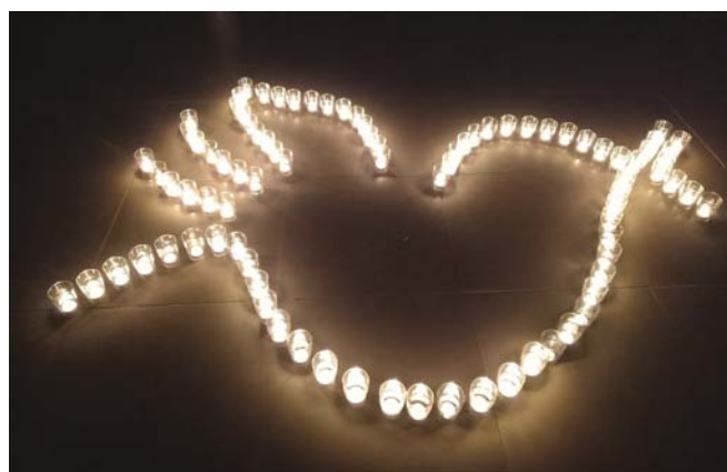
oben: Friedensgebet beim Korbbrunnen