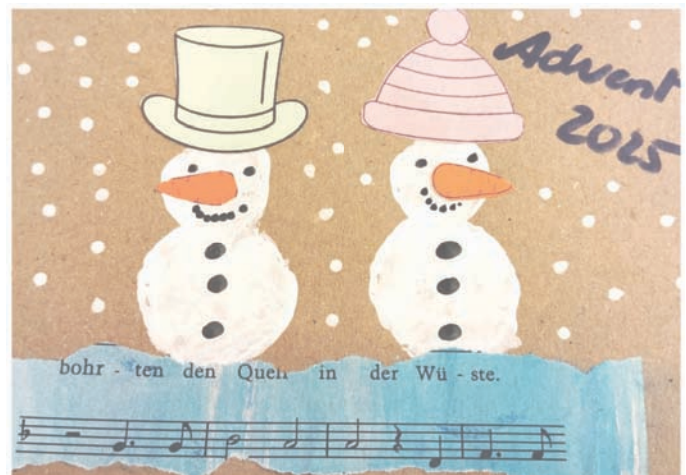
Einladung zur Adventfeier der kfb