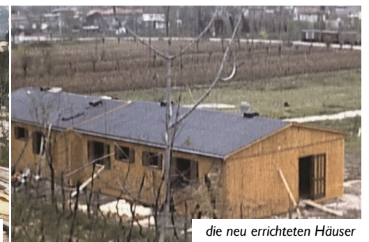
die neu errichteten Häuser