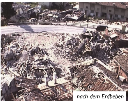
nach dem Erdbeben