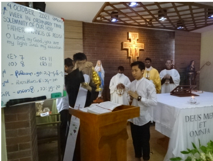
4. OKTOBER: FEST DES HEILIGEN FRANZISKUS, IN UNSERER HAUSKAPPELE IN YANGON