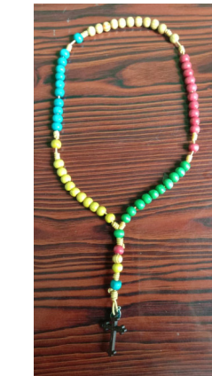
Missionsrosen- kranz, 4 Farben symbolisieren 4 Kontinente.

You-tube Empfehlung: The adventure of being a missionary