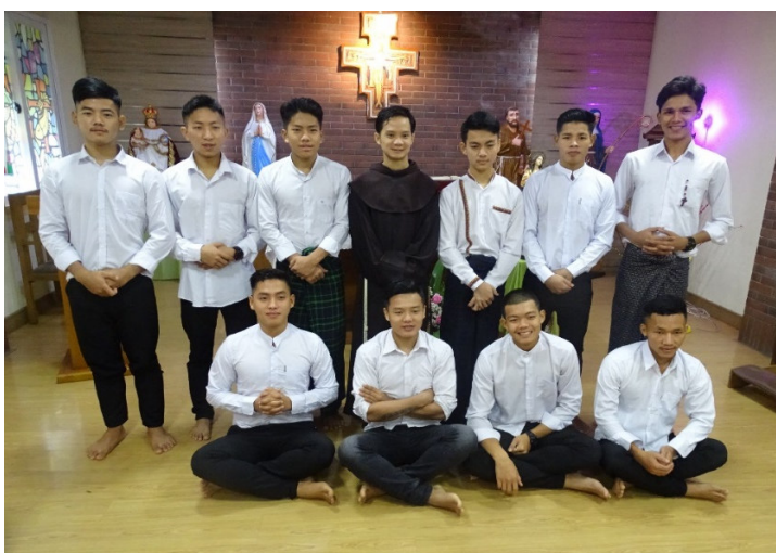
FEIER DER AUFNAHME NEUER KANDIDATEN, 2. AUGUST 2021