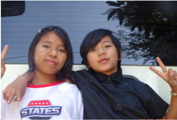
MÄDCHEN VOM WAISENHAUS MYAUNGTAGA (Datum auf dem Foto stimmt nicht!)