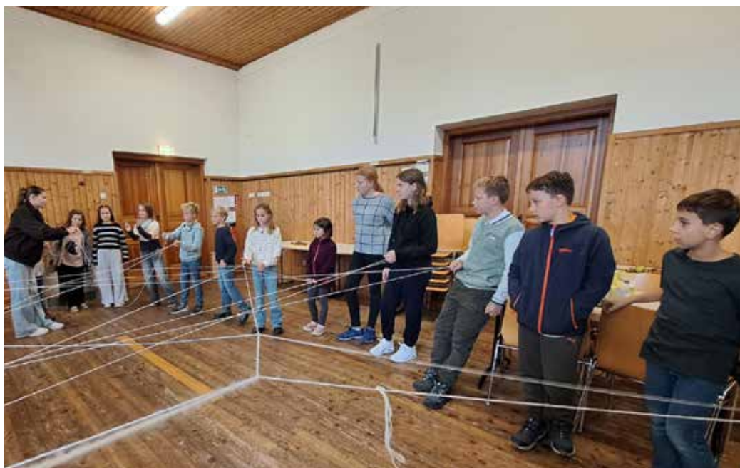
Die Kinder stellten sich der Herausforderung des Kennenlern-Netzes.