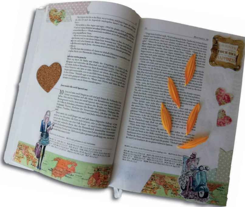
Gestaltung & Foto Elena Hautz

! Weiterführende Tipps/Literatur/Web-Adressen findest du unter: ooe.kjweb.at/1gutenachricht