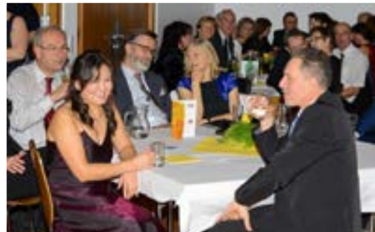
Gut gelaunte Pfarrballgäste