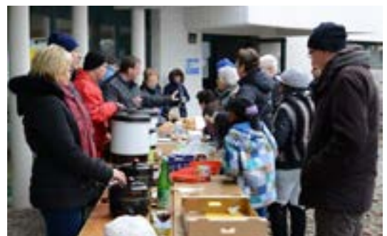
Punsch und Pofesen vor den Bratwürsteln