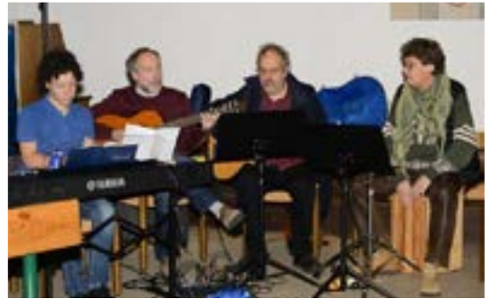
Musikalische Messgestaltung mit Schwung