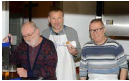
Büfettmitarbeiter mit langjähriger Erfahrung