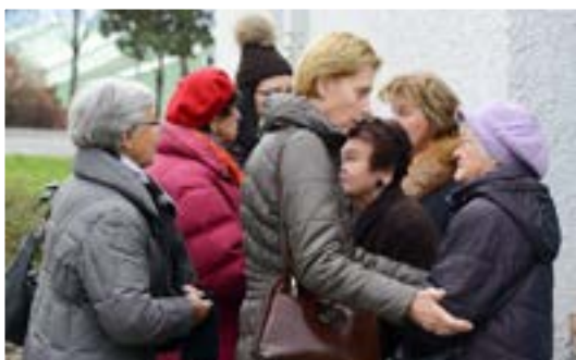
Wichtige Neuigkeiten am Kirchenplatz