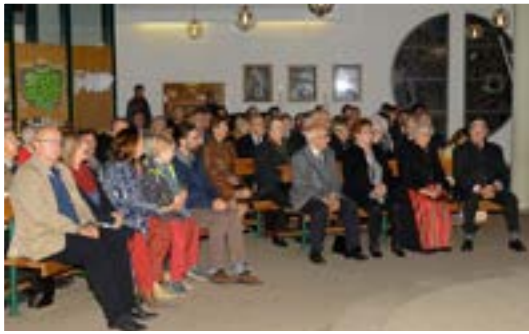
Festgäste beim Ehejubiläum