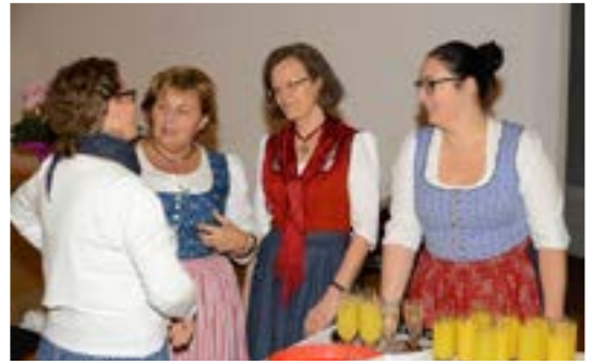
Goldhaubenfrauen verköstigen die Ehejubilare