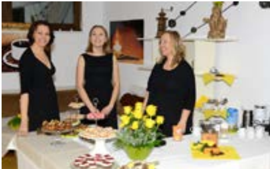
Nette Bedienung in der Bohnengasse