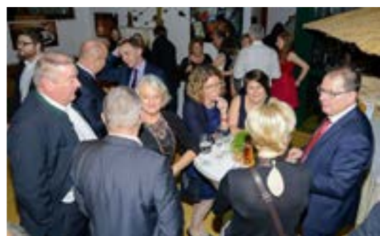
Auch nach Mitternacht war es noch gemütlich