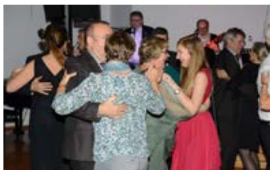
Wildes Treiben auf der Tanzfläche