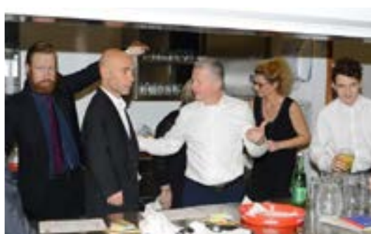
Die Kommandozentrale am Pfarrball