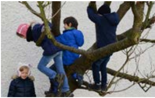
Immer voller Kletterbaum am Pfarrplatz