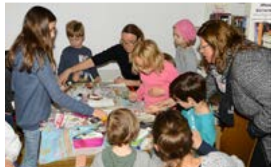
Großer Andrang am Kinderbasteltisch