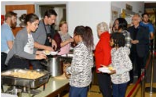
Hunderte Knödel wandern in unsere Bäuche