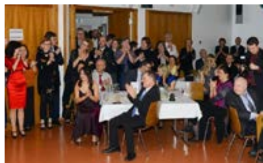
Jubel nach der Performance der „Jungen“