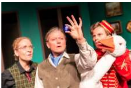
Theater des Kindes: SHERLOCK HOLMES