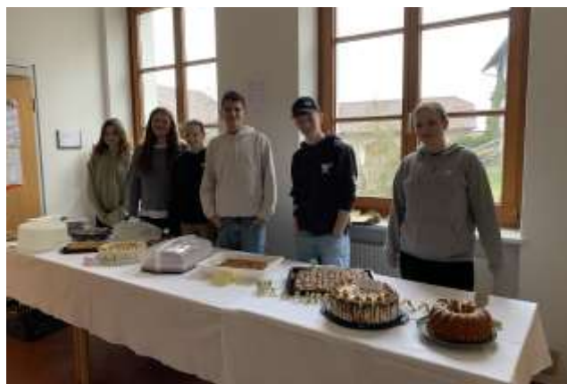
... und beim Verkauf der Mehlspeisen

Der Erlös des Pfarrkaffees kam dieses Mal den Ministranten zugute, die sich für die internationale Ministranten Wallfahrt im August nach Rom angemeldet haben. Die Mädchen und Buben halfen mit großem Eifer bei der Vorbereitung und beim Verkauf der Mehlspeisen mit.