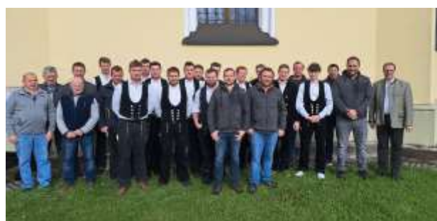
Josefmesse in der Kapelle Gundertshausen