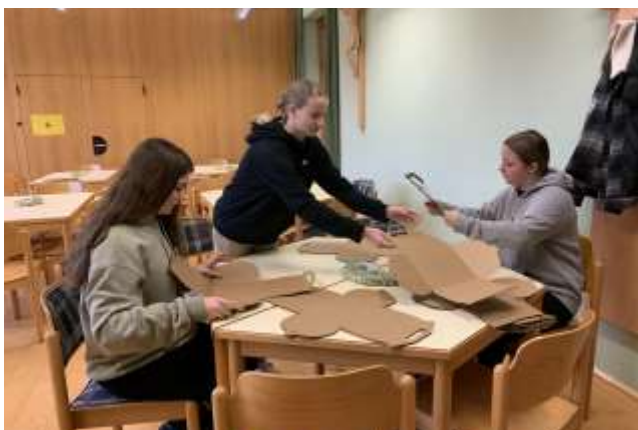
Ministranten bei der Vorbereitung ...