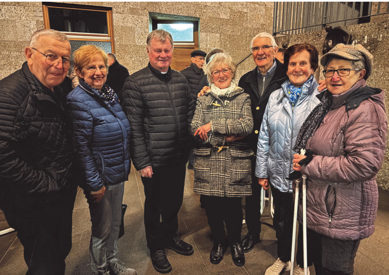
Bischof Manfred Scheuer zu Besuch in Gallspach