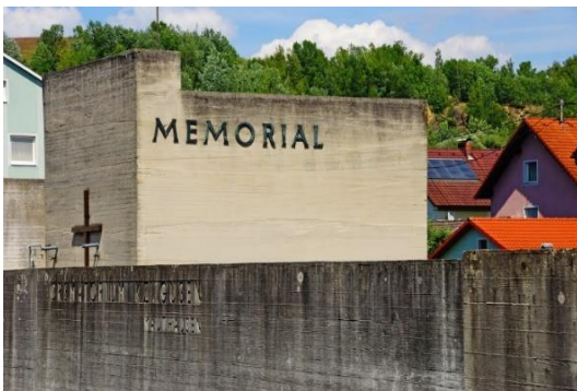
Abbildung 3: Memorial Gusen

Ehemalige polnische und französische Insassen des Konzentrationslagers Gusen errichteten, eine inoffizielle Gedenkstätte rund um die noch vorhandenen Reste des Krematorium Ofens. Als die Grundstücke 1960 verkauft wurden und die Reste des Krematorium Ofens abgerissen werden sollten, kauften ehemalige italienische Häftlinge das Grundstück rund um das Krematorium und schenken es der Gemeinde. Schließlich war die Gemeinde 1961 mit dem Bau einer offiziellen Gedenkstätte einverstanden. Dieses Projekt wurde von der Architektengruppe B.B.P.R. (Banfi, Belgiojoso, Peressutti und Rogers) geplant. Nach seiner Fertigstellung folgte am 8. Mai 1965 die Einweihung. Das Österreichische Bundesministerium für Inneres trägt seit 1997 die Verantwortung für den Erhalt und die Betreuung des Memorial Gusen. Das anliegende Besucherzentrum wurde erst 2004 eröffnet. Die hier ansässige Dauerausstellung kann man seit dem Herbst 2005 besichtigen. 38