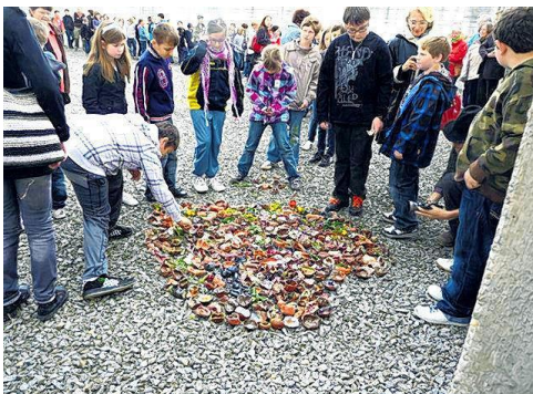
Abbildung 6: Kunstprojekt – 420 Tonherzen

Das Thema wurde auch kreativ behandelt, wir haben Theaterstücke aufgeführt und Fotocollagen gestaltet. Zum Abschluss des Projektes hatten wir eine Kindergedenkfeier beim Memorial Gusen. Hier wurden unter anderem 420 offene Tonherzen, die wir zuvor im Werkunterricht gemacht hatten, zu einem großen Herzen zusammengefügt. Dieses Denkmal gestalteten wir gemeinsam mit der New Yorker Kunstprofessorin Karen Finley. Es sollte an den Massenmord an 420 Kindern im Konzentrationslager Gusen erinnern. 52