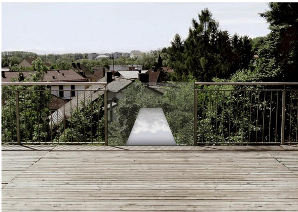
Abbildung 5: Spiegelsteg

Als Letztes wurde die Hülle des Kriegerdenkmals, gemeinsam mit einem Foto vom verhüllten Denkmal, im Fenster des Pfarrheims aufgebaut. 44