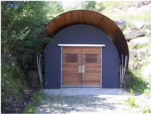
Abbildung 4: „Bergkristall“ Eingang

Neben dem heutigen Eingang der Stollenanlage wurde im Mai 2015 ein Denkmal für die polnischen Opfer errichtet. Im Dezember 2015 folgten schließlich noch die Informationstafeln neben dem Eingang. Beides wurde aus polnischer Initiative aufgestellt. 39