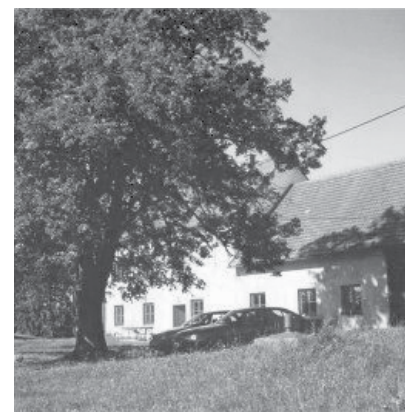
Das Lagerhaus in Gloxwald