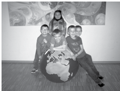
Die JS-Kinder haben großen Spaß mit der Weltkugel

Die Jungschar und katholische Jugend Krenglbach bedanken sich ganz herzlich bei der Raiffeisenbank Krenglbach für ihre großzügige Spende. Damit konnten wir für die Jungschar eine überdimensionale Weltkugel und für die Jugend gemütliche Riesen-Sittsäcke kaufen. Ein herzliches Vergelt's Gott dafür!