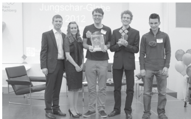
Überreichung des JS-Globes am 9. Februar in Puchberg

Zu dieser tollen Leistung gratuliert die Pfarre recht herzlich!