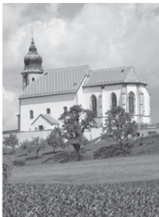
Pfarrkirche zur hl. Ottilia in Kollmitzberg

Ottilia gilt als Fürbitterin bei Augenleiden und als Patronin der Steinmetze, deren Augenlicht durch Stein-splitter sehr gefährdet ist. Sie wird auch als Fürbitterin für