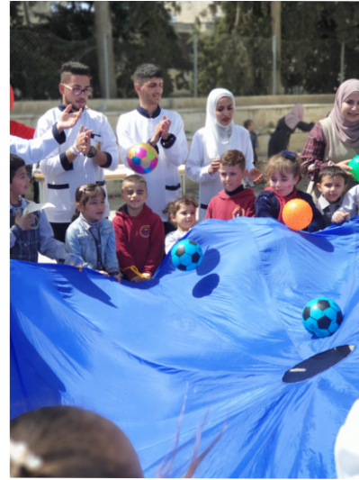
Fotos: Die Projekte der Studierenden machen Alt wie Jung Freude