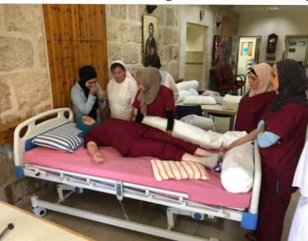
Foto: Fortbildung zur Dekubitus-Prophylaxe