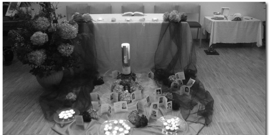
Nachmittag für Trauernde

Wie jedes Jahr übernahm die KFB die Bewirtung der Gäste. Wir danken allen Frauen, die uns Kuchen und Kaffee zur Verfügung gestellt haben und allen, die mitgeholfen haben. Herzlichen Dank dem Büchereiteam und den Besuchern.