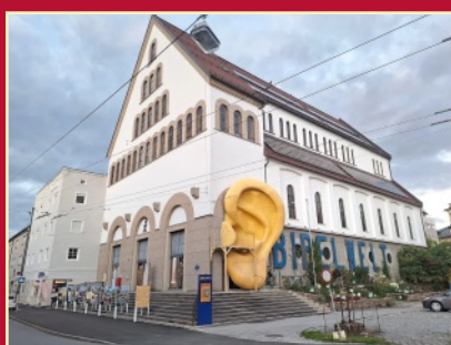
Bibel-Ausflug S. 6