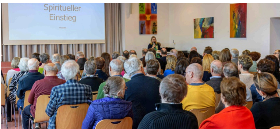
Beim Visionstreffen in St. Laurentz wurden die Weichen gestellt, jetzt in Asten geht es darum, den Weg genauer einzurichten.