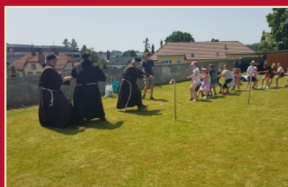
Pfarrfeste S. 12