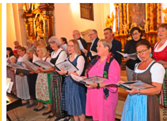
PFARRFIRMUNG Samstag, 14. Juni 2025