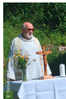
BERGMESSE GASSELHÖHLE Samstag, 21. Juni 2025