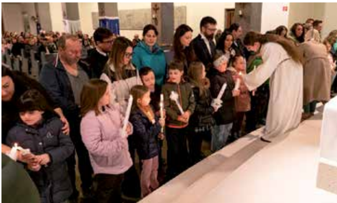
Die Taufkerzen wurden entzündet.

Am 7. März 2026 feierten die 40 Erstkommunionkinder ihr Tauferneuerungsfest im Rahmen der Vorabendmesse. Gemeinsam mit den Paten zündeten die Kinder ihre Taufkerzen an und erneuerten ihr Taufversprechen.