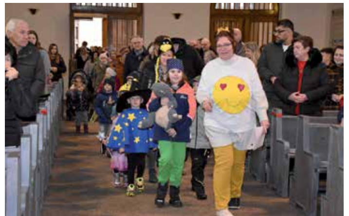
bunt verkleidet beim Einzug in die Kirche

Im Anschluss an den Gottesdienst gab es im Pfarrheim noch ein gemütliches Beisammensein beim Frühschoppen und für die Kinder ein Kasperltheater und Faschingskrapfen.