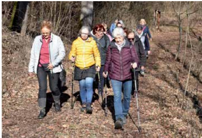
Frühlingsgefühle kamen auf

Dass der Wetterbericht nicht immer stimmt, stellten die Teilnehmer der Wanderung am 12. Februar fest. Statt des vorhergesagten miesen Wetters mit Regen und Wind strahlte die Sonne und die Temperatur erinnerte schon an den Frühling. Schöner hätte die Wanderung zum Schneerosenweg nicht sein können. Dieser machte seinem Namen auch alle Ehre, Schneerosen waren genug zu bestaunen.