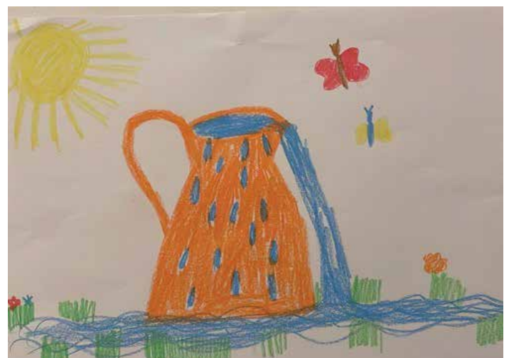
Foto: Schülerzeichnung vom ISZ