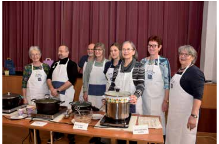
das Team der Suppenköch:innen

Insgesamt wurden € 1.813,00 gespendet und an die österreichweite Aktion der kfb weitergeleitet. Herzlichen Dank!